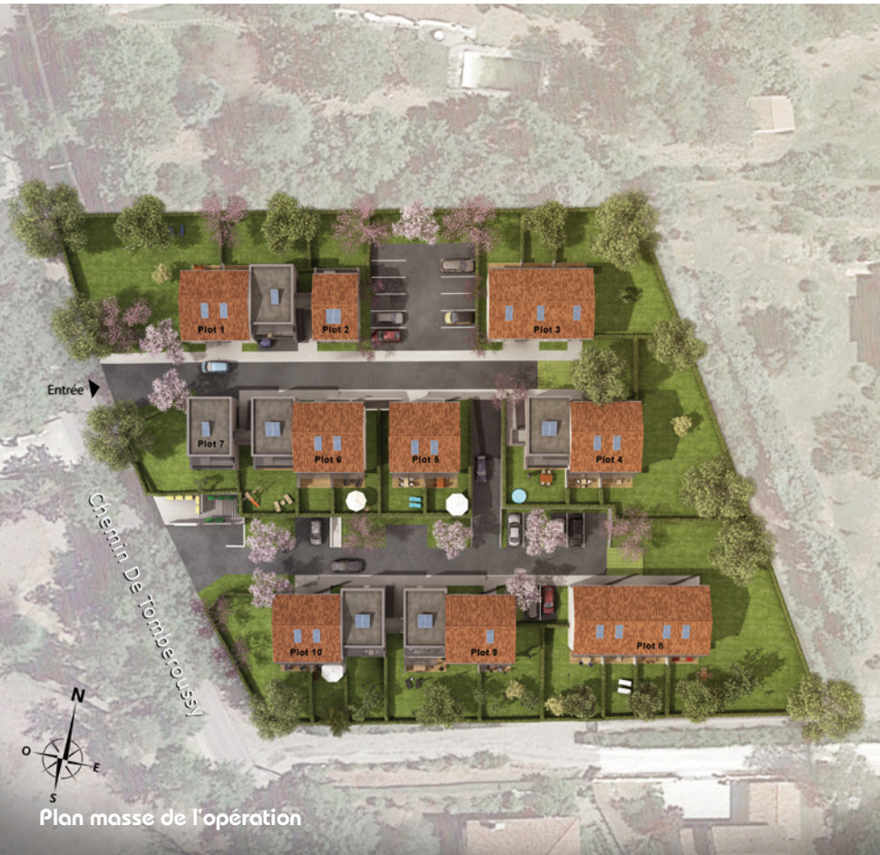
Plan masse de l'opération