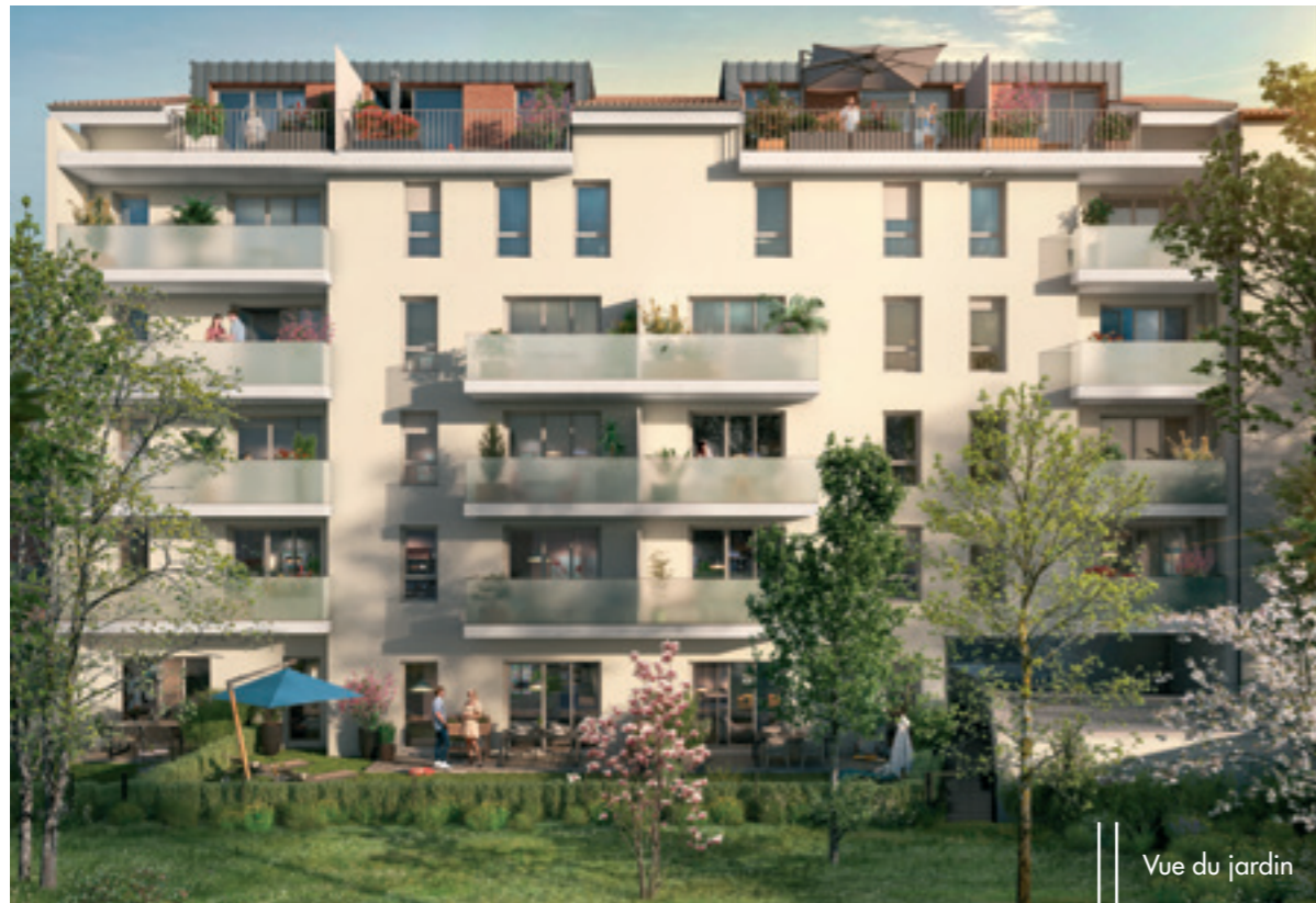
Vue du jardin