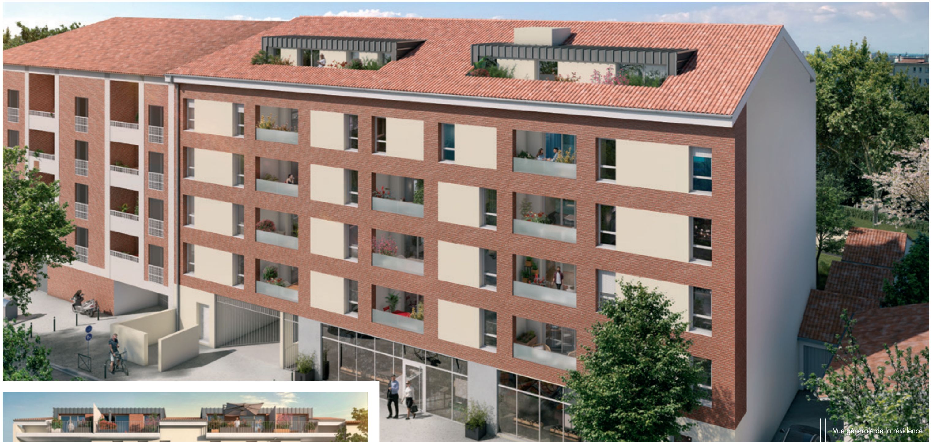
Vue générale de la résidence