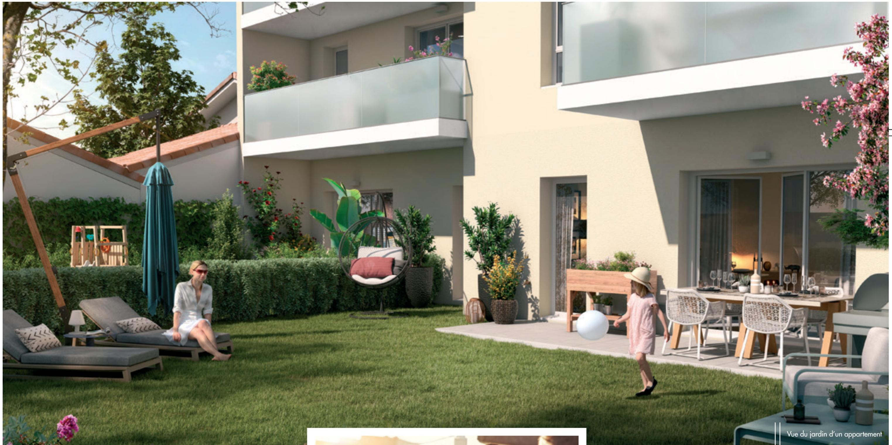
Vue du jardin d'un appartement