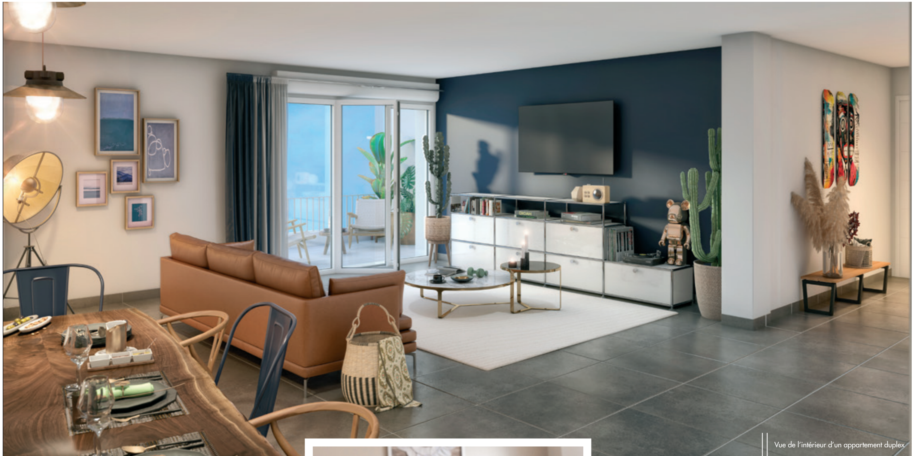
Vue de l'intérieur d'un appartement duplex