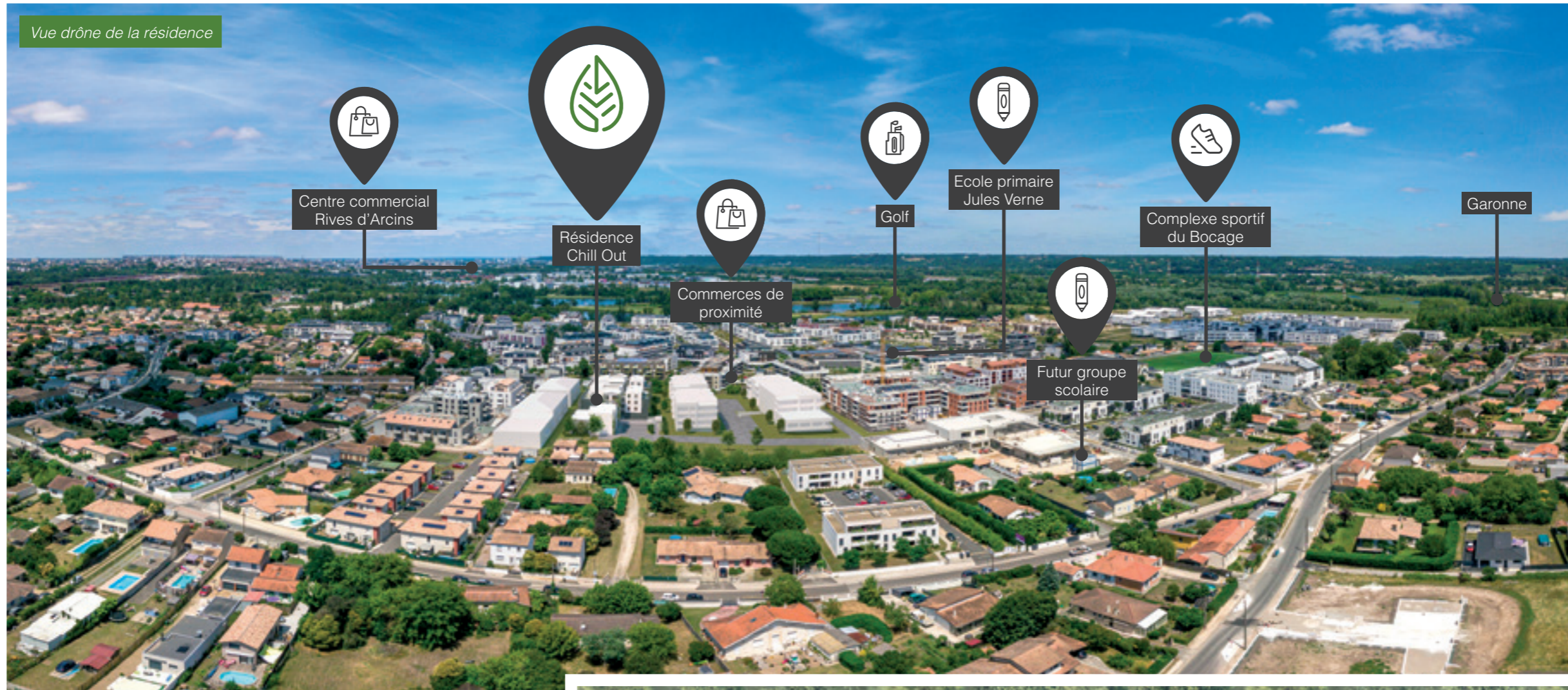
Vue drone de la résidence