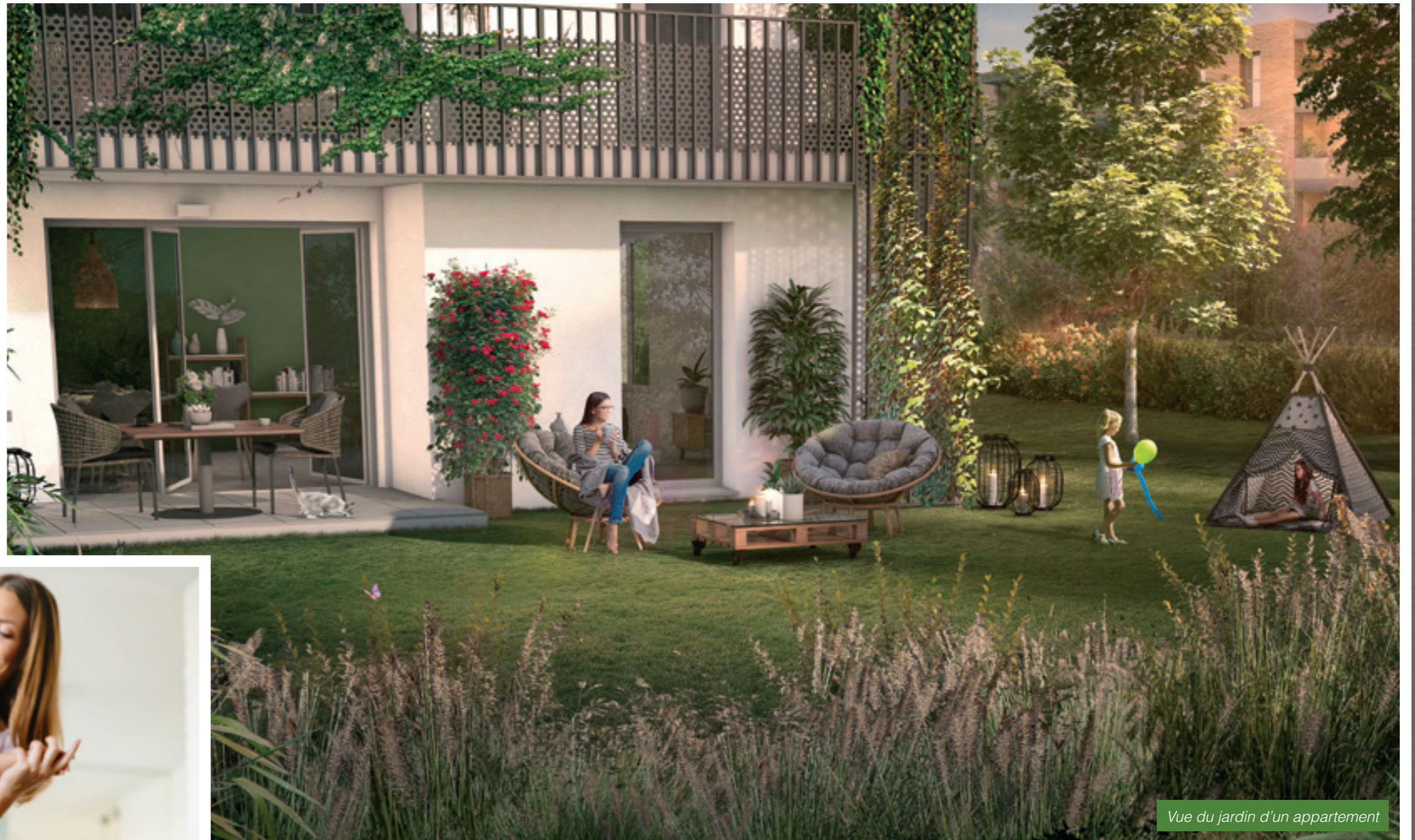
Vue du jardin d'un appartement