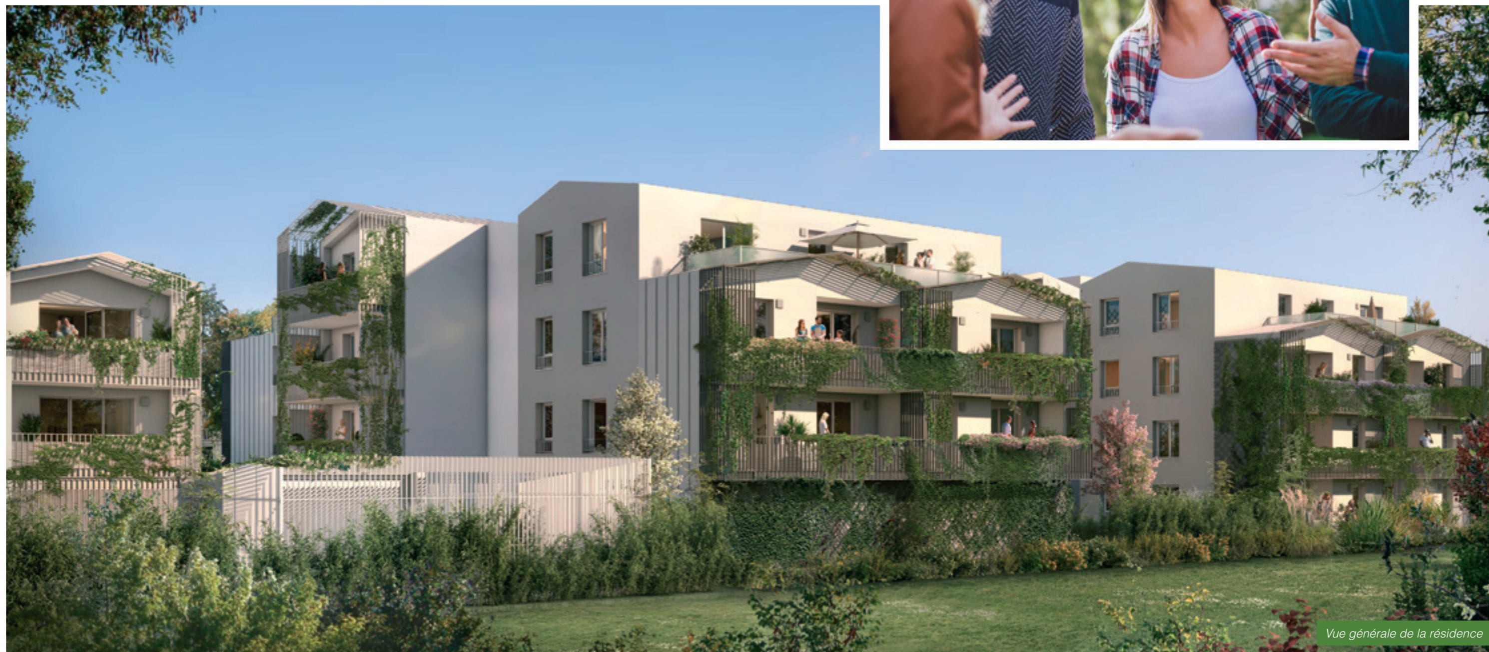
Vue générale de la résidence