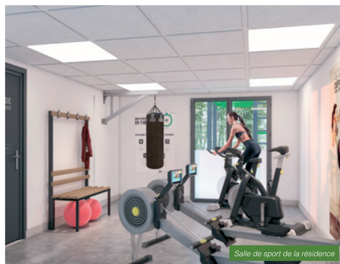
Salle de sport de la résidence

Ce projet a pour ambition de créer un cadre de vie d'exception à Villenave d'Ornon, où les loisirs et la nature font partie intégrante du quotidien.