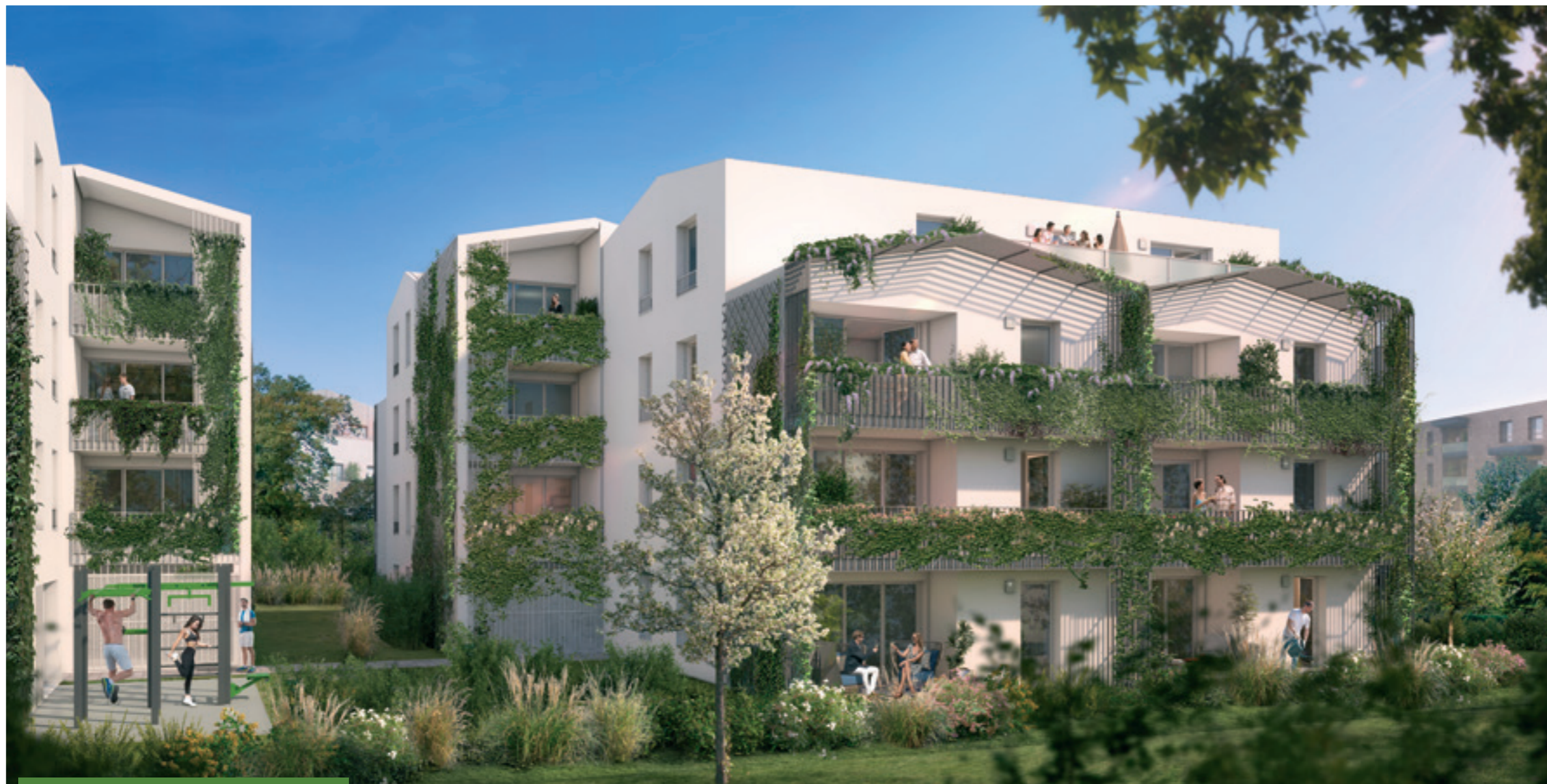
Vue du cœur d'îlot et de son espace Crossfit