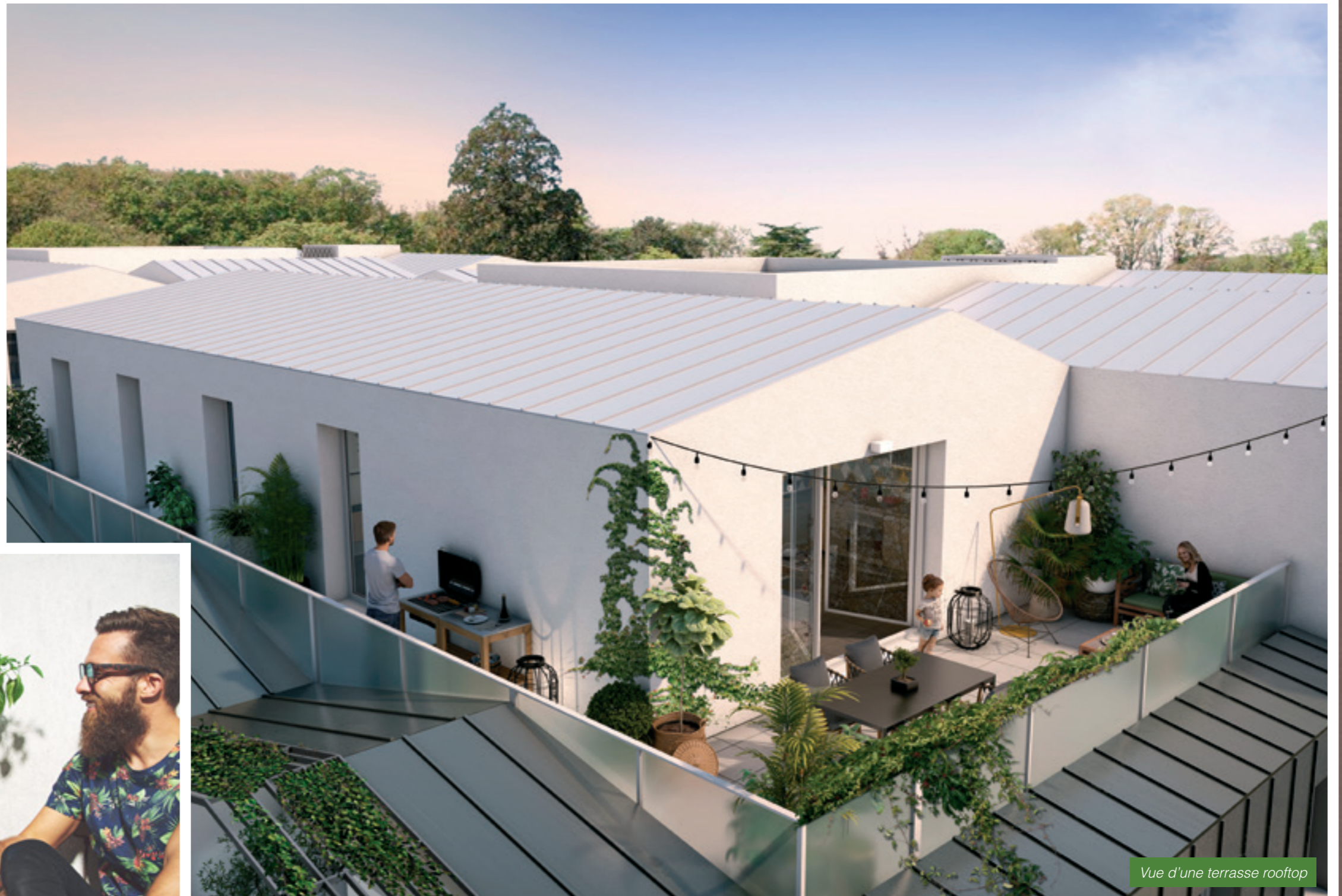
Vue d'une terrasse rooftop