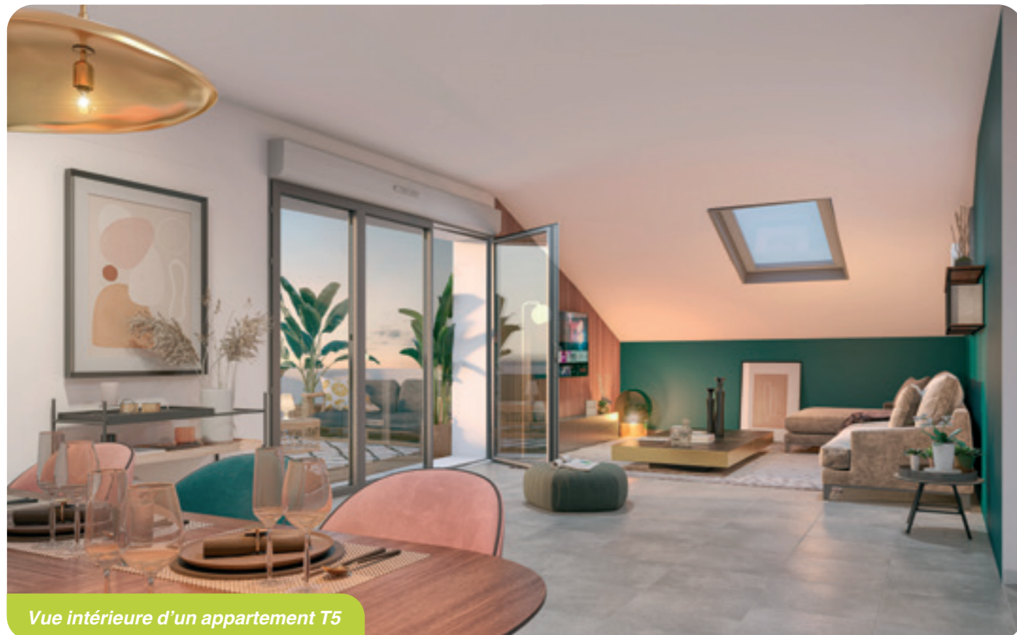
Vue intérieure d'un appartement T5