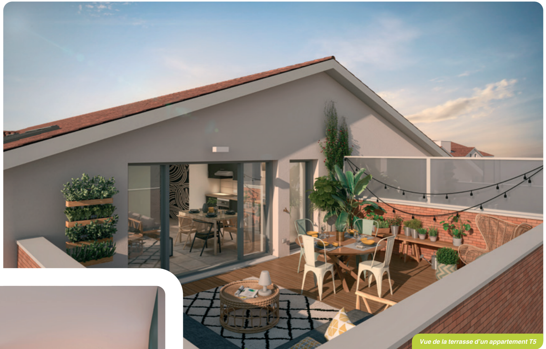
Vue de la terrasse d'un appartement T5