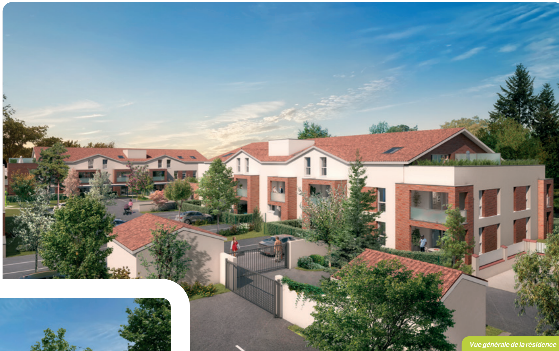
Vue générale de la résidence

“ Le charme de la ville à la campagne !”