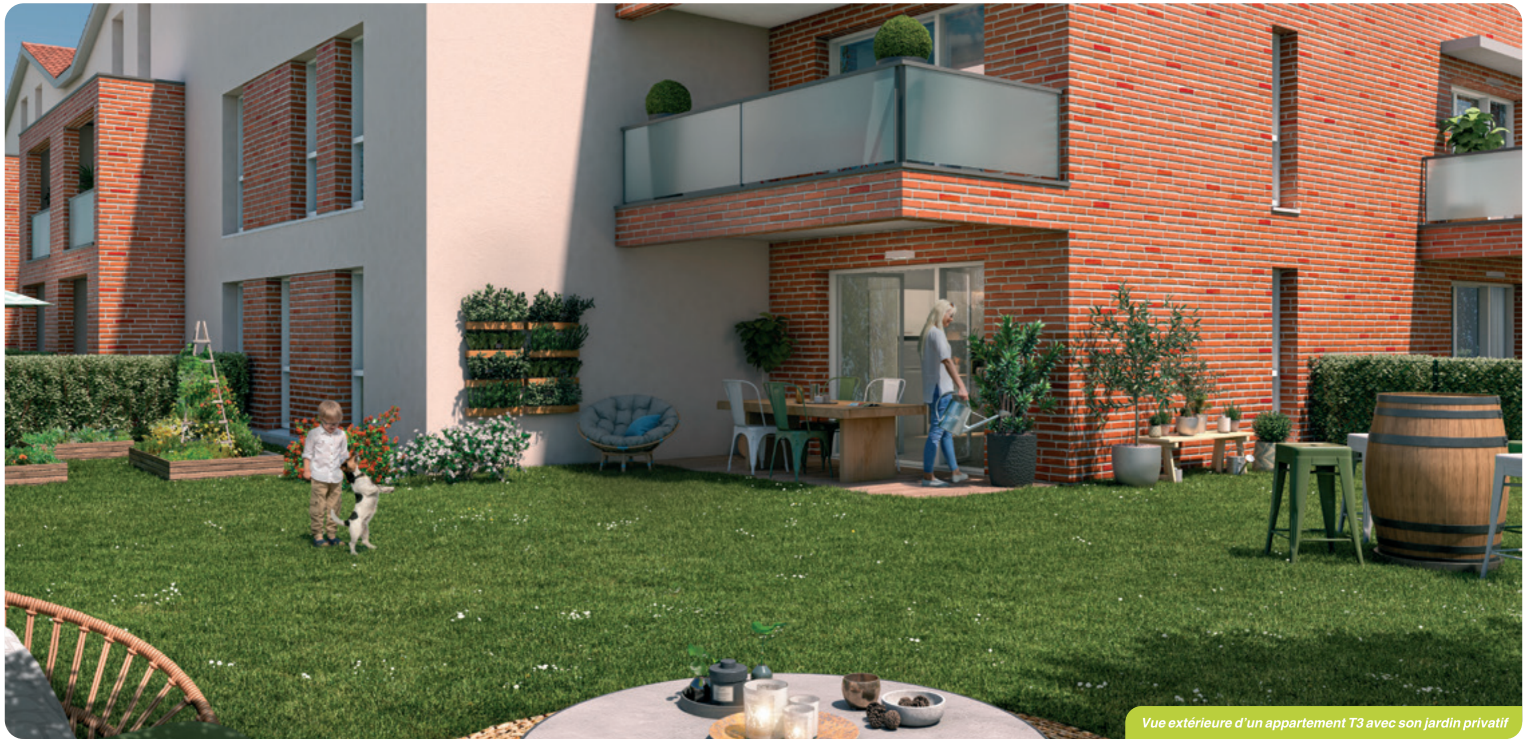
Vue extérieure d'un appartement T3 avec son jardin privatif