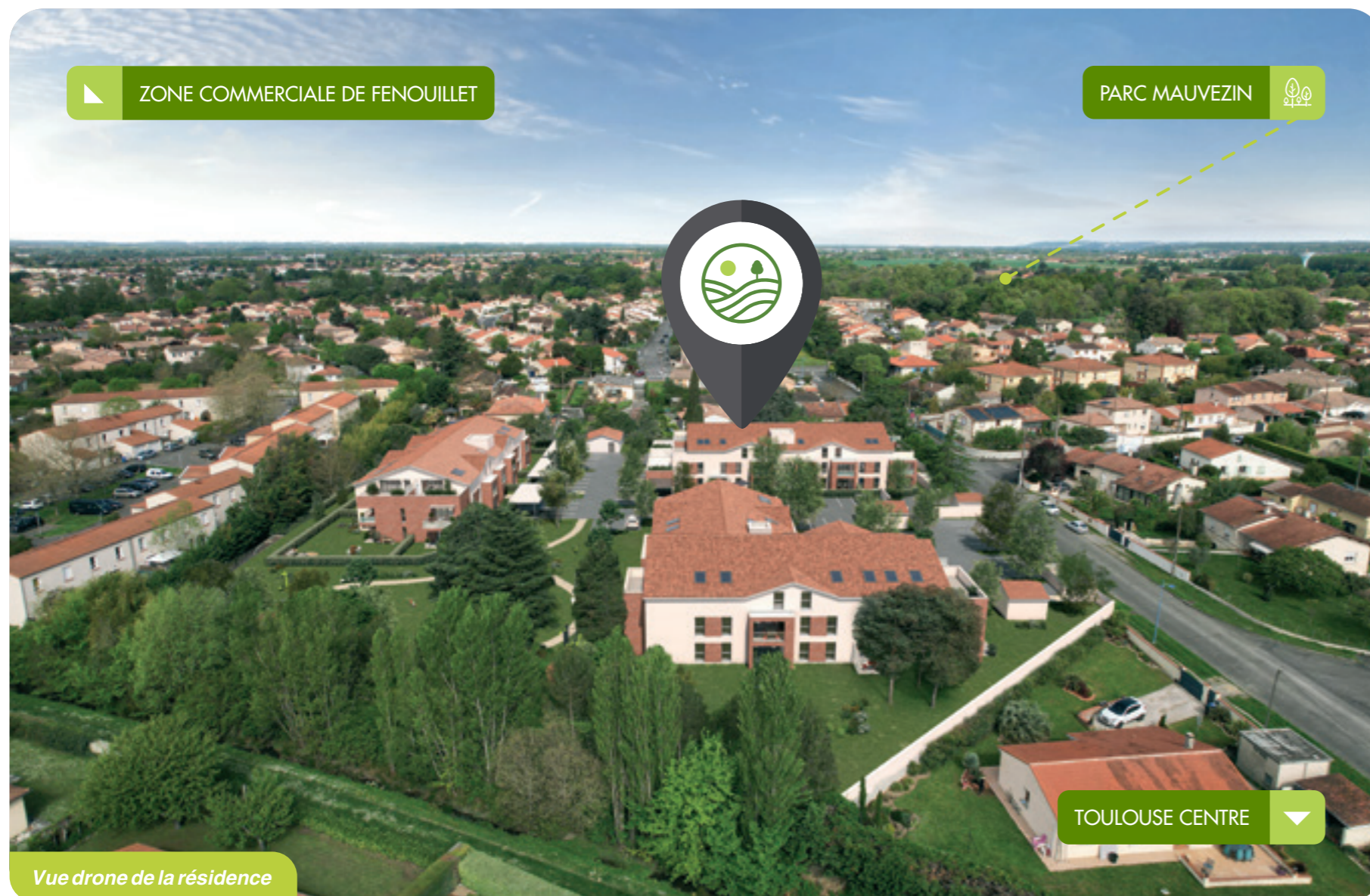
Vue drone de la résidence