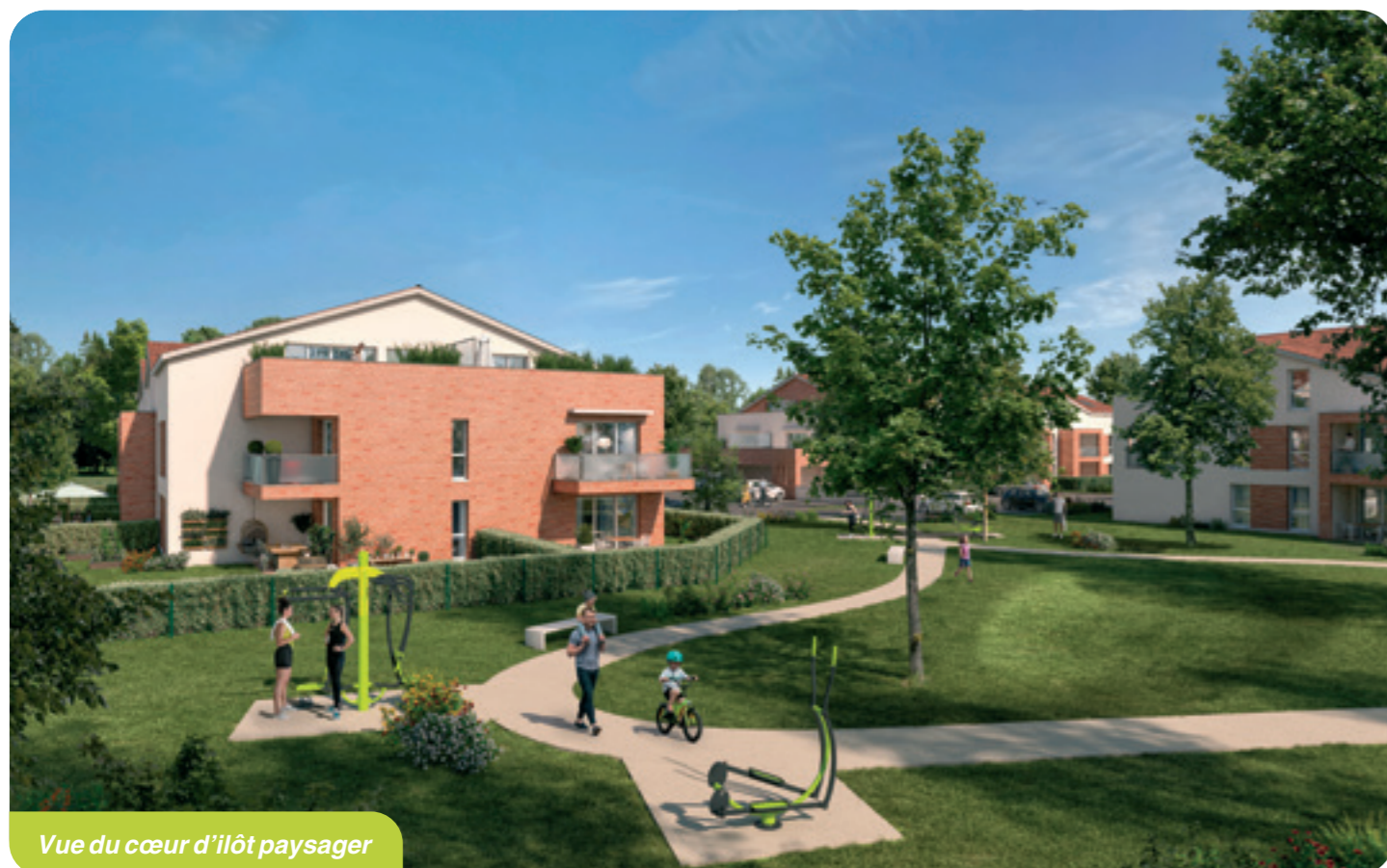
Vue du cœur d'îlot paysager

De nombreuses plantations seront réalisées en plus de la végétation existante et vous profiterez d'un espace paysager collectif aménagé. Un espace est prévu pour accueillir aire de jeux pour enfants et tables de pique nique. Jardin, balcon ou terrasse, vous profiterez aussi des beaux jours grâce à un extérieur privatif pour chacun des appartements.