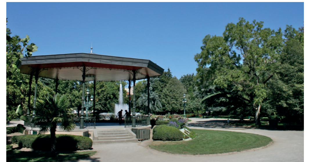
A proximité du Jardin des Plantes, le plus beau Jardin de Toulouse, un poumon vert en hyper centre

Avoisinants également la zone universitaire de Rangueil , les infrastructures scolaires, sportives et culturelles, ainsi que les services et les équipements de santé, ces quartiers s'imposent comme un lieu où la vitalité et la facilité prédominent. Les musées, les théâtres, les cinémas, sont eux aussi à quelques encablures seulement. Et cela, tout en vous laissant l'espace nécessaire, et même au-delà, pour prendre de grandes respirations près de l'eau et de la verdure.