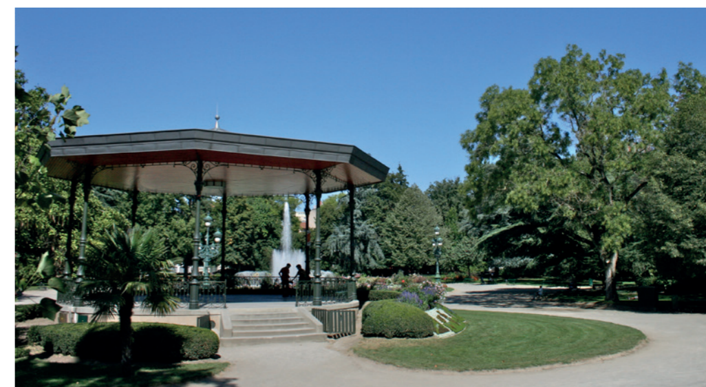
A proximité du Jardin des Plantes, le plus beau Jardin de Toulouse, un poumon vert en hyper centre

Avoisinants également la zone universitaire de Rangueil , les infrastructures scolaires, sportives et culturelles, ainsi que les services et les équipements de santé, ces quartiers s'imposent comme un lieu où la vitalité et la facilité prédominent. Les musées, les théâtres, les cinémas, sont eux aussi à quelques encablures seulement. Et cela, tout en vous laissant l'espace nécessaire, et même au-delà, pour prendre de grandes respirations près de l'eau et de la verdure.