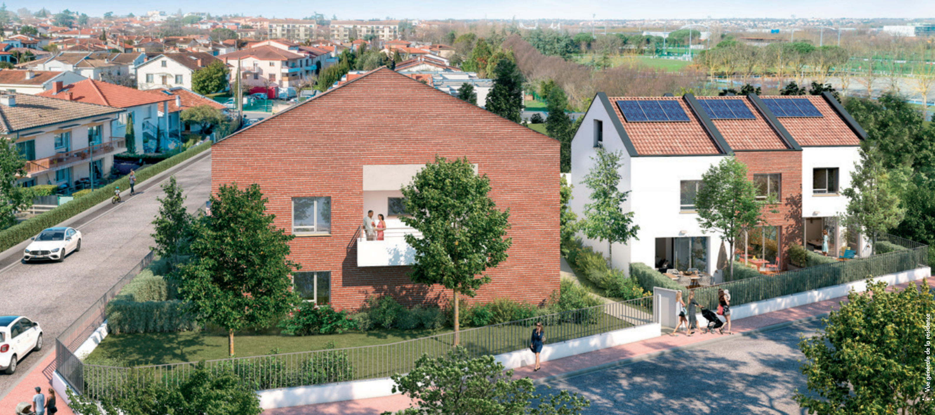
Vue générale de la résidence