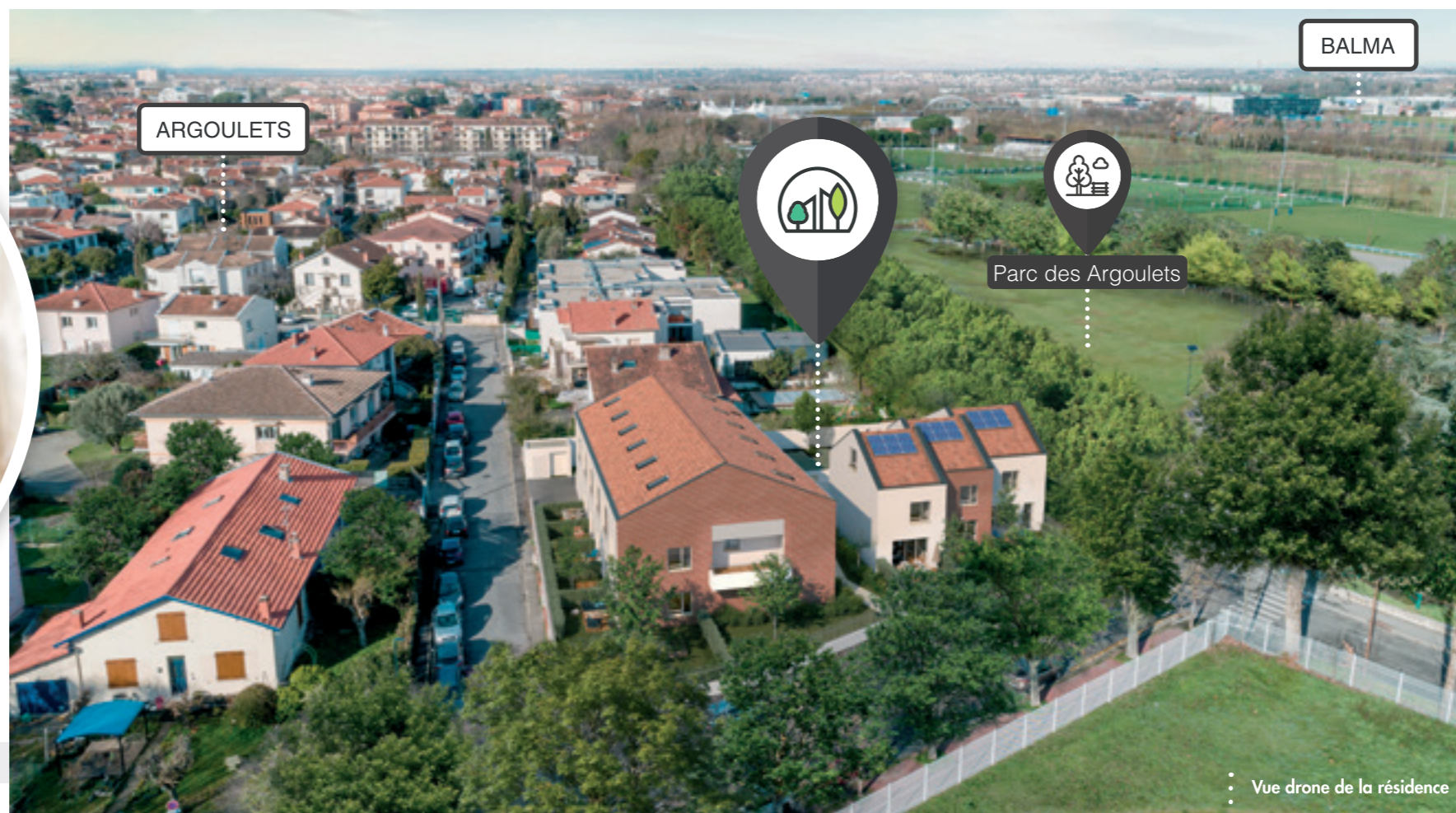
Vue drone de la résidence