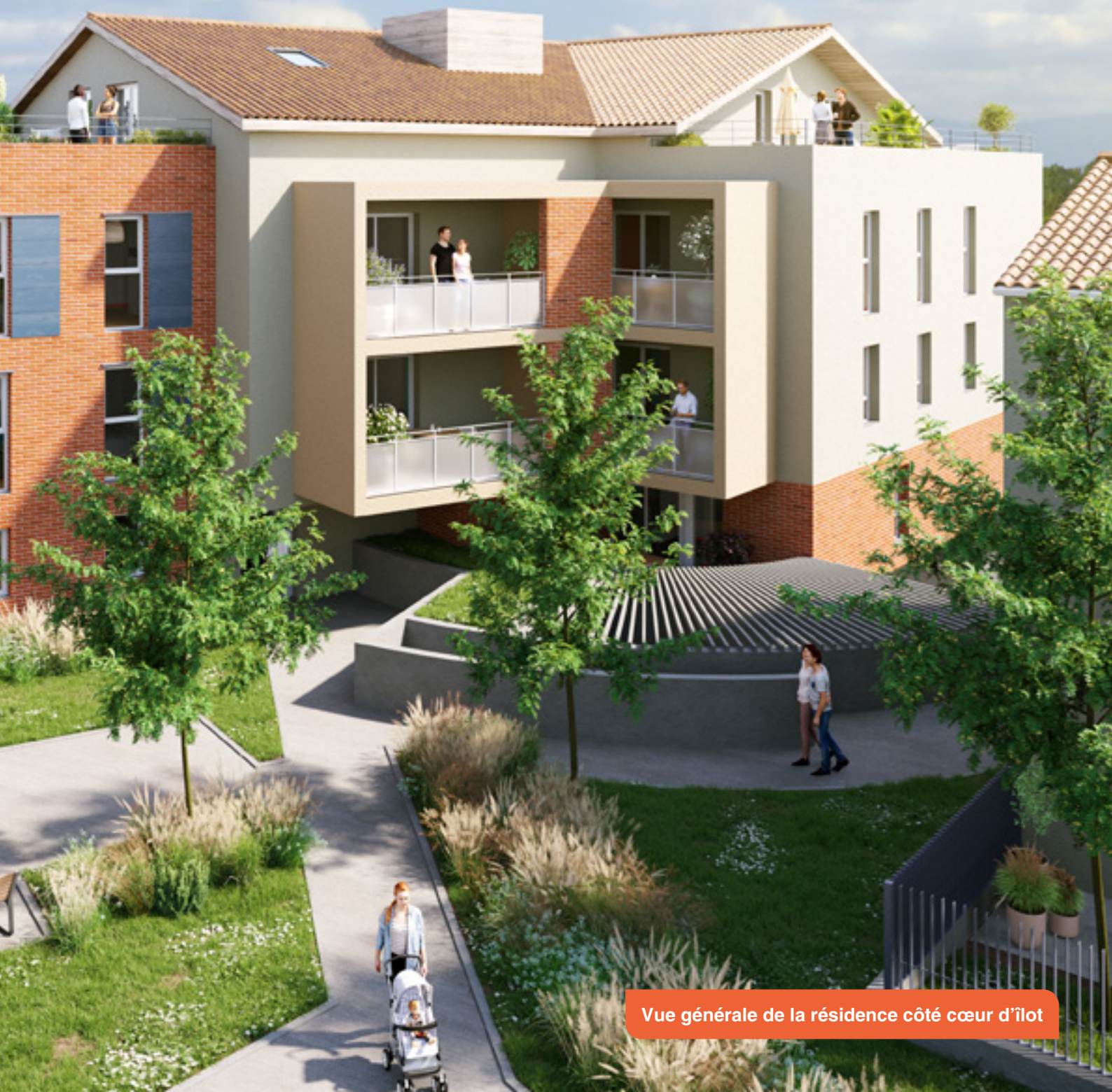
Vue générale de la résidence côté cœur d'îlot