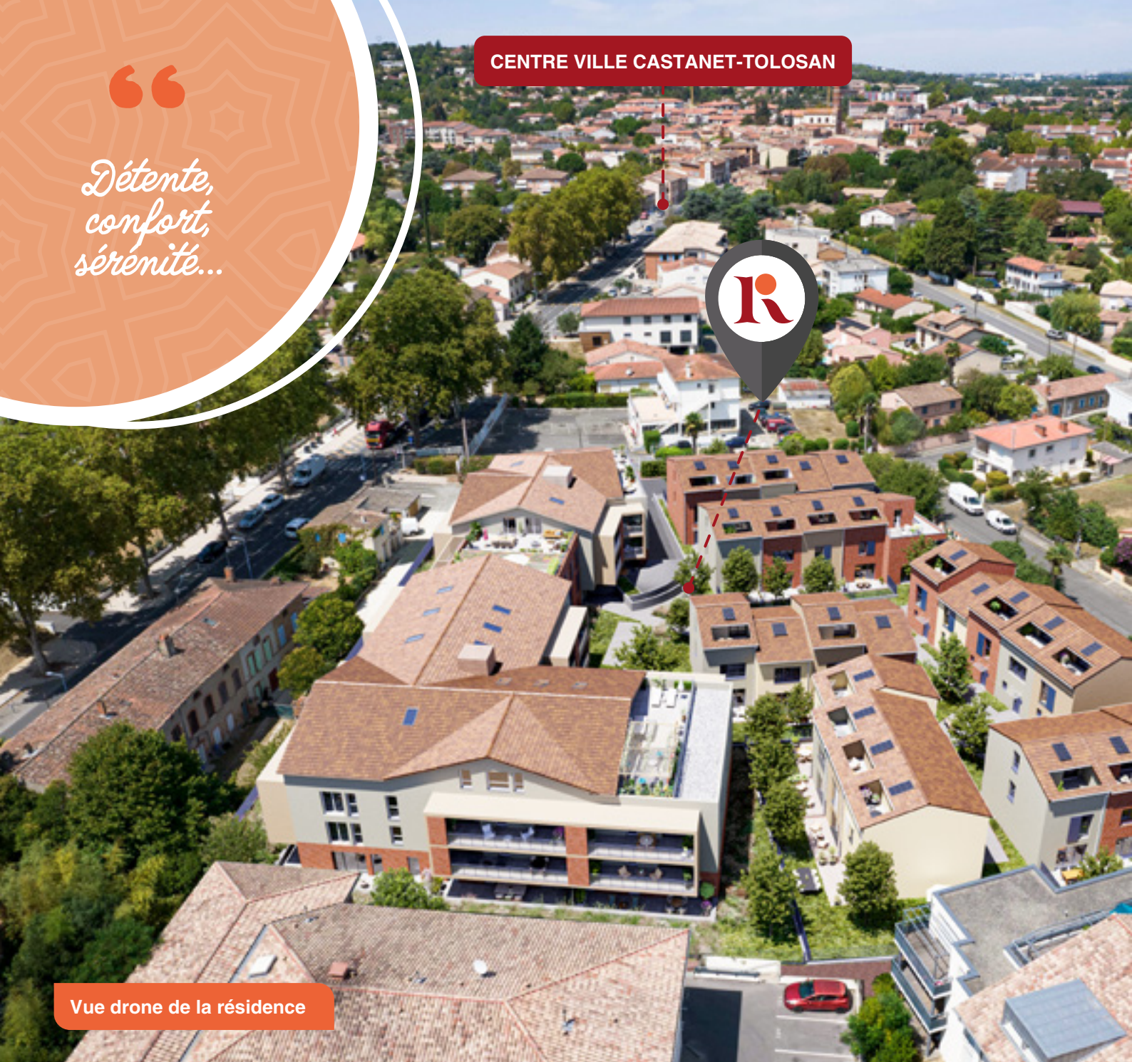
Vue drone de la résidence