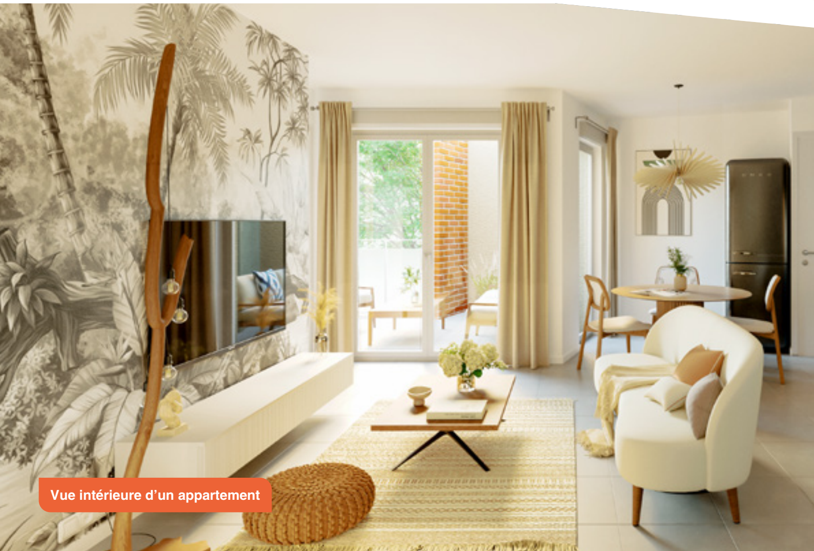
Vue intérieure d'un appartement