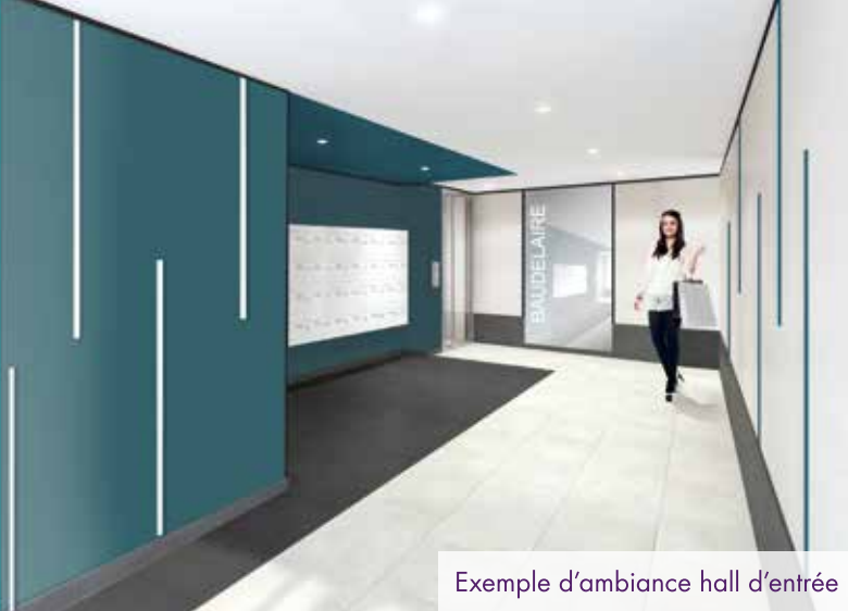
Exemple d'ambiance hall d'entrée