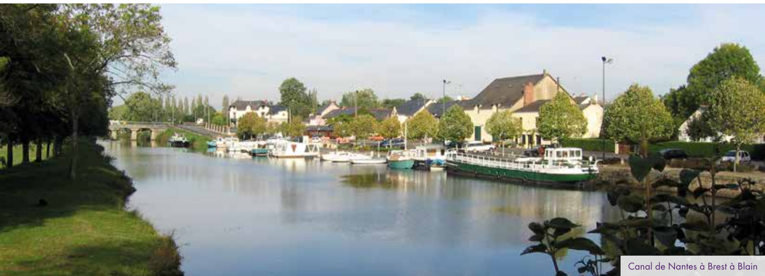
Canal de Nantes à Brest à Blain