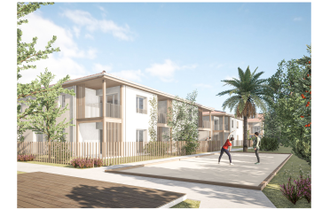
1-11 RUE BELLEVUE 33850 LÉOGNAN