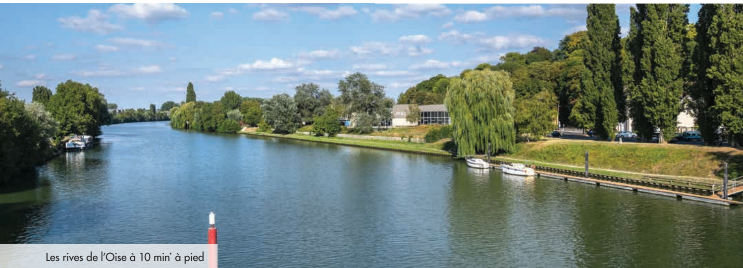
Les rives de l'Oise à 10 min* à pied