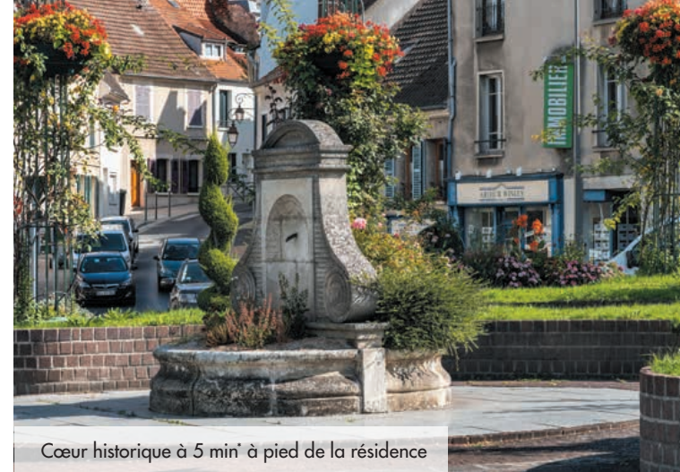
Cœur historique à 5 min* à pied de la résidence

À 35 kilomètres* de Paris, Beaumont-sur-Oise profite de sa situation privilégiée, entre l'Oise et la forêt de Carnelle, pour offrir un cadre de vie des plus agréables à ses habitants. Autour de son centre historique animé par les commerces et les restaurants, la ville dispose de nombreux équipements, hôpital, écoles et stades... Avec les gares SNCF de Persan-Beaumont et de Nointel-Mours à ses portes, elle n'est qu'à 31 et 36 minutes* de Paris.