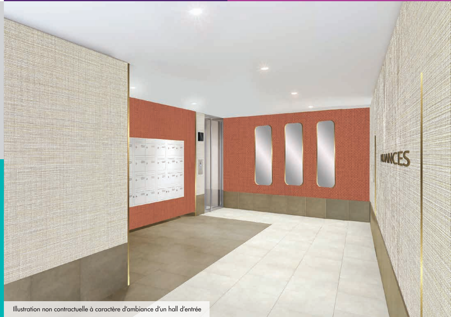
Illustration non contractuelle à caractère d'ambiance d'un hall d'entrée