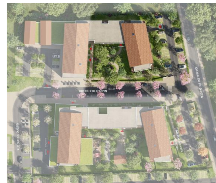
Soléa : Plan de masse

Le volume des appartements, les prestations , les nombreuses ouvertures pour emplir les logements de lumière naturelle , les espaces extérieurs, les stationnements en sous-sol, sont autant d'agréments visant à offrir un confort agréable et une belle qualité de vie , dans un quartier et dans une ville à la fois paisible et vivante.