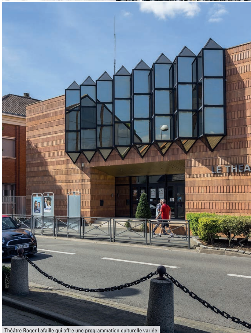
Théâtre Roger Lafaille qui offre une programmation culturelle variée