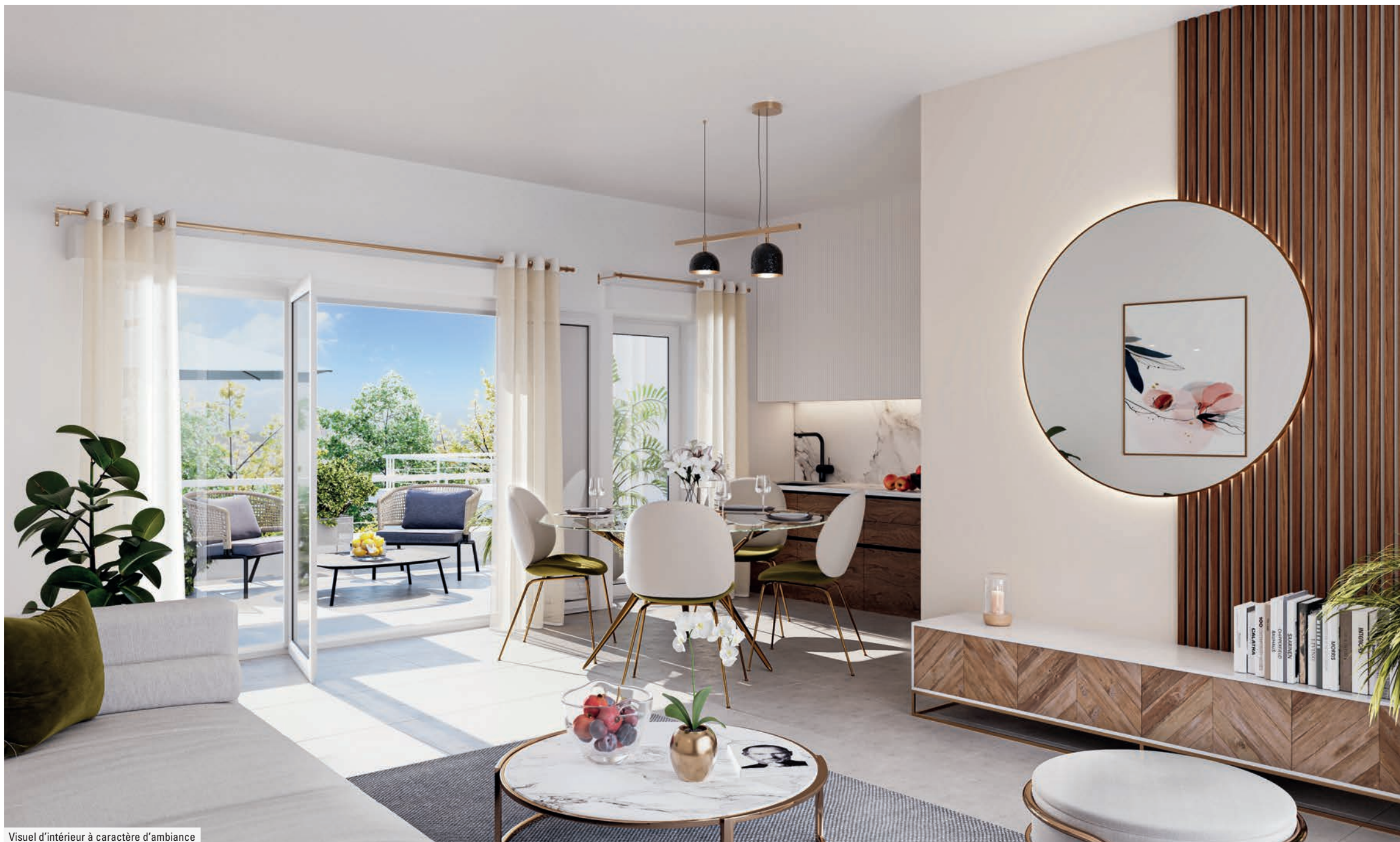
Visuel d'intérieur à caractère d'ambiance