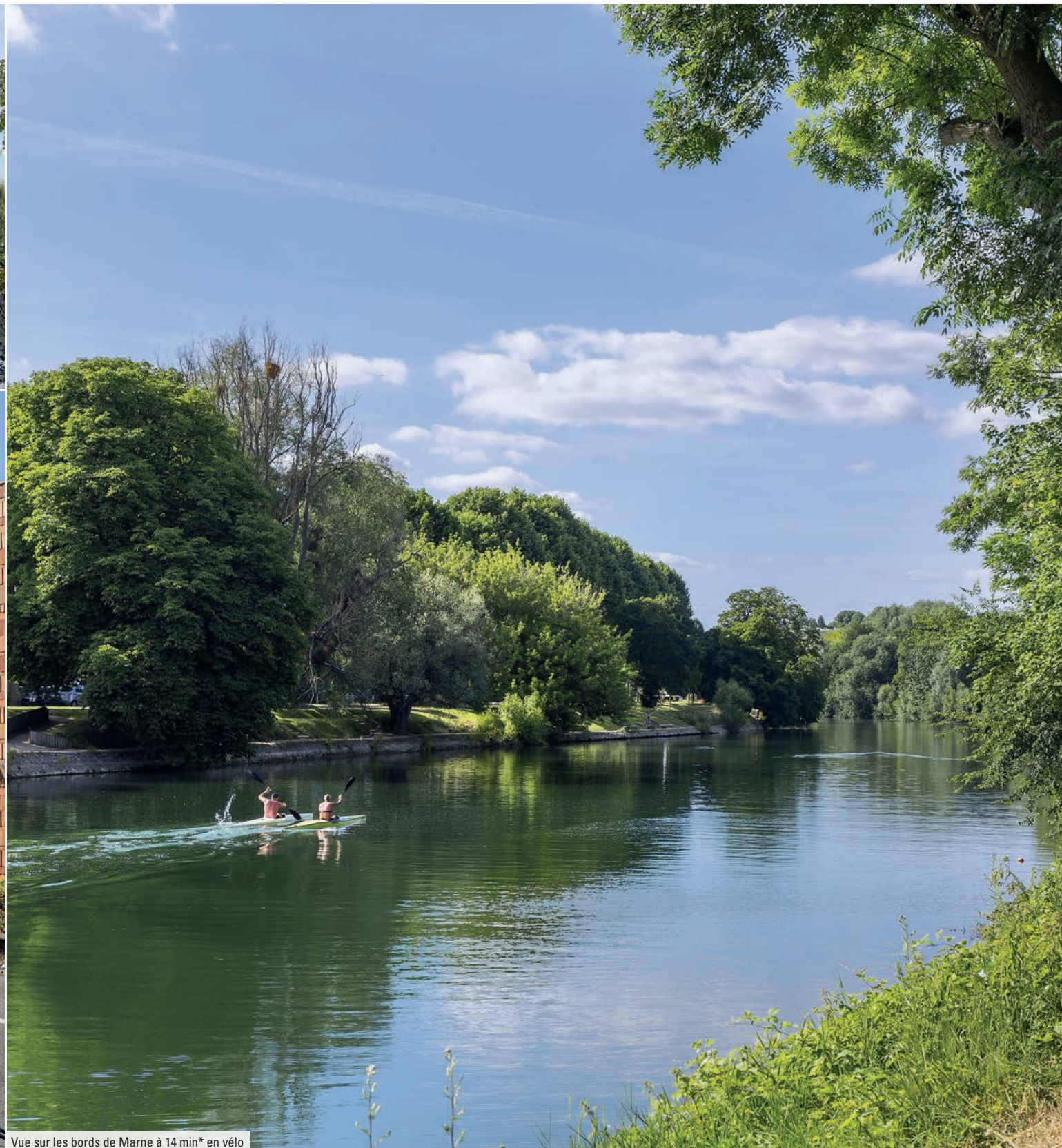
Vue sur les bords de Marne à 14 min* en vélo