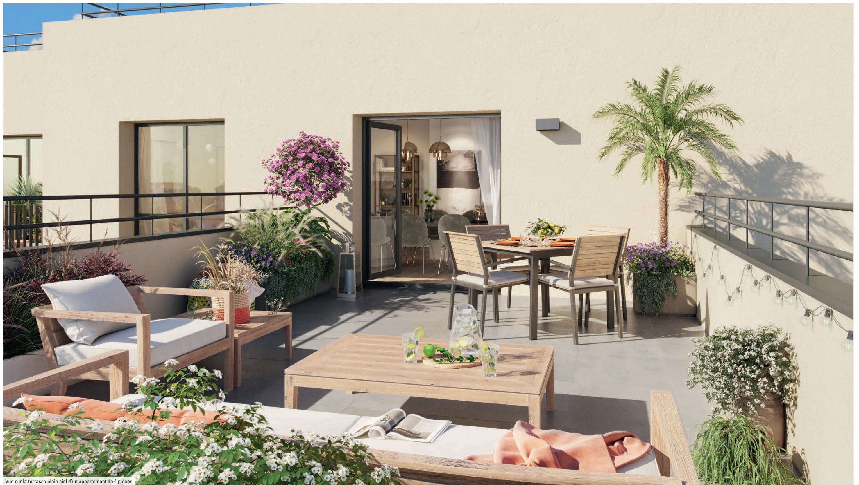
Vue sur la terrasse plein ciel d'un appartement de 4 pièces