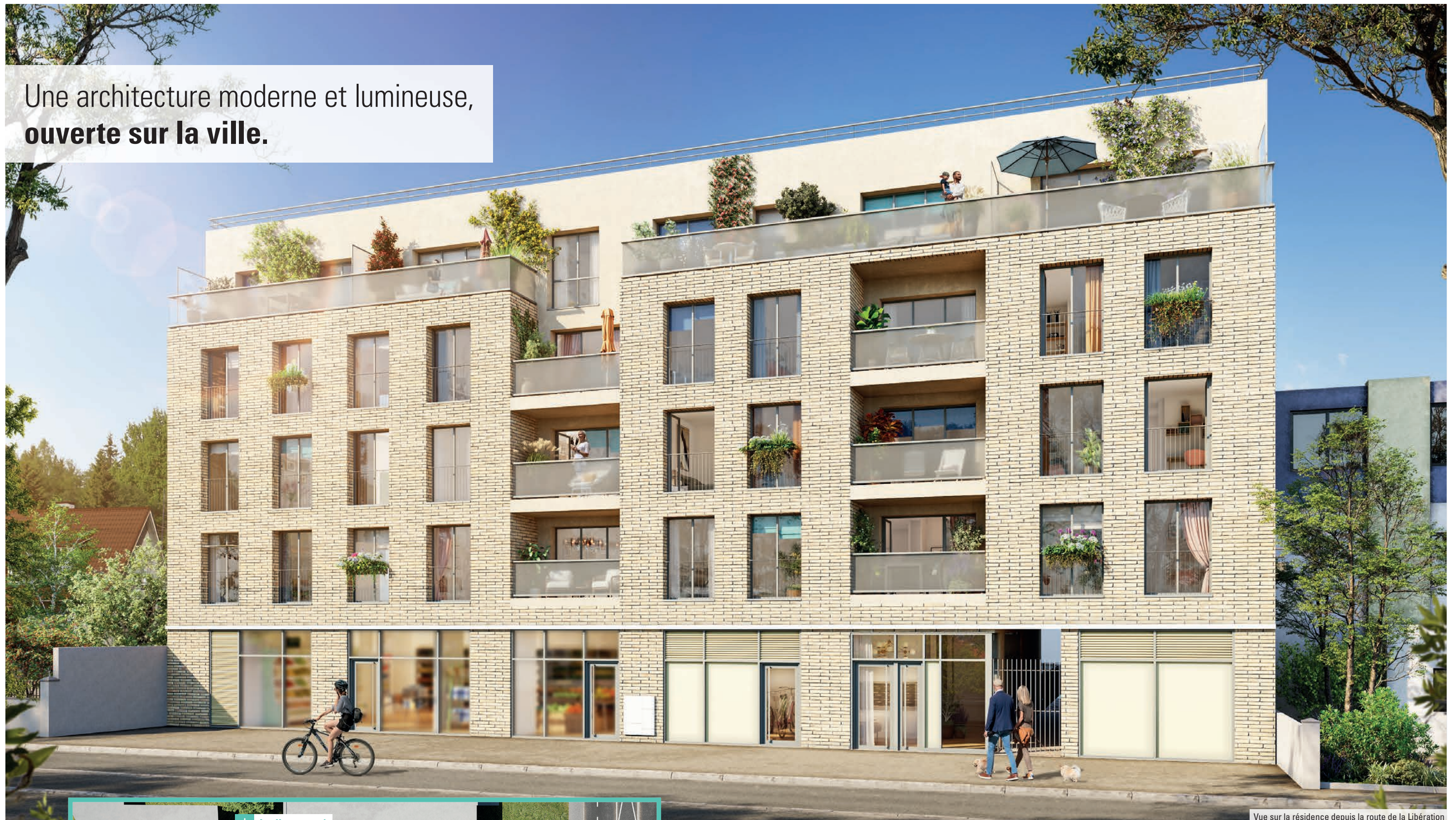
Vue sur la résidence depuis la route de la Libération

Une architecture moderne et lumineuse, ouverte sur la ville.