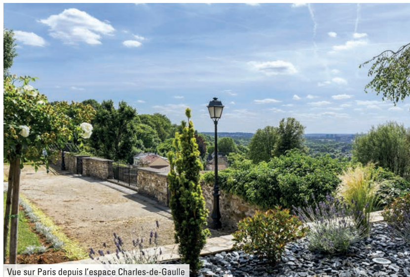
Vue sur Paris depuis l'espace Charles-de-Gaulle