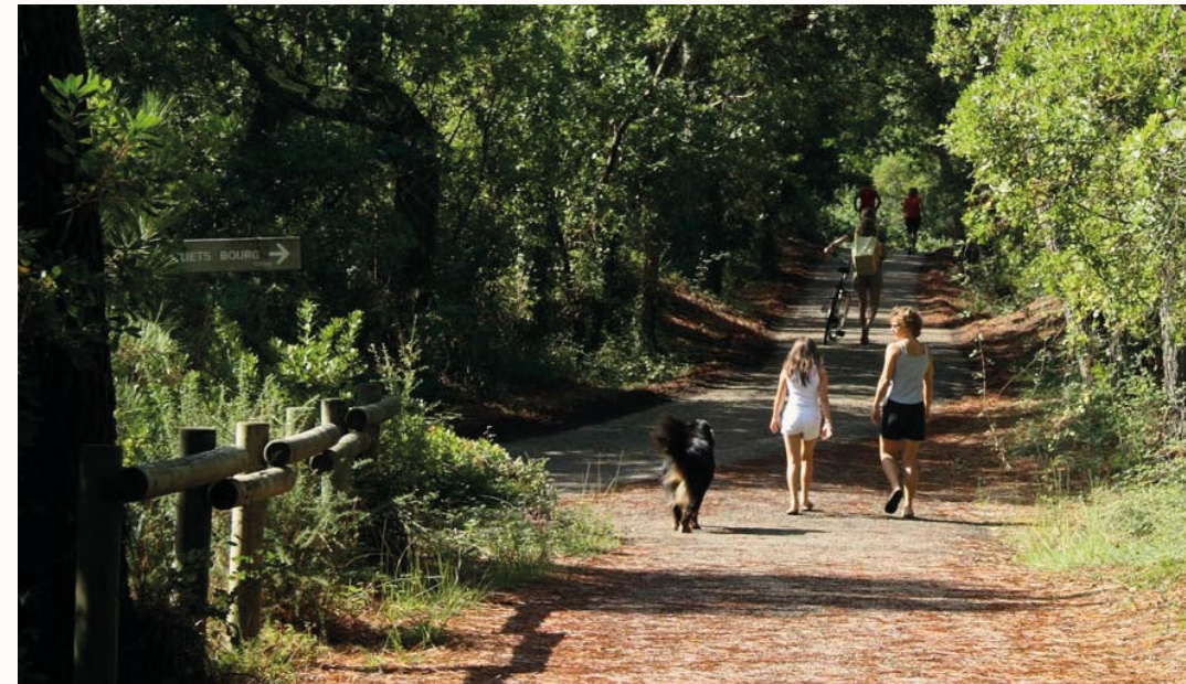
Fôret de Chiberta 64600 Anglet.