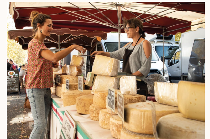
Marché du Quintaou All. de Quintaou, 64600 Anglet