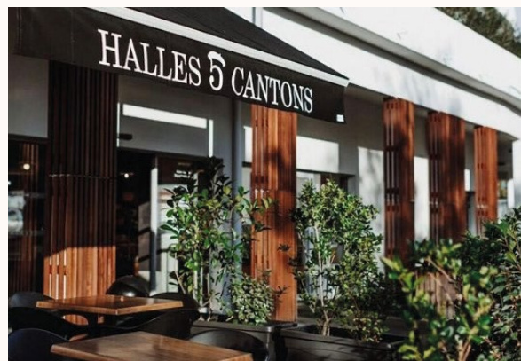
Halles des 5 Cantons 11 Rue Paul Courbin, 64600 Anglet