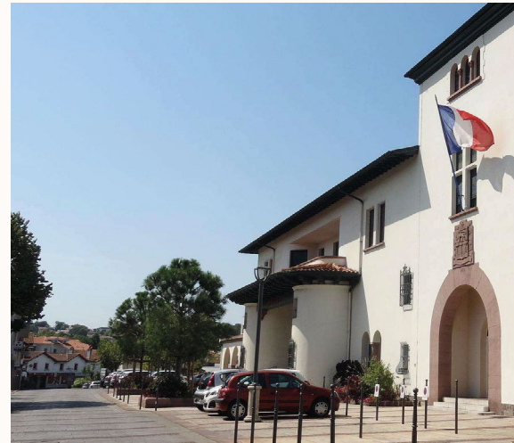
Mairie d'Anglet Rue Amédée Dufourg, 64600 Anglet