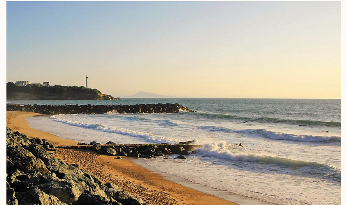
Plage de la Chambre d'Amour 22 Av. des Dauphins, 64600 Anglet