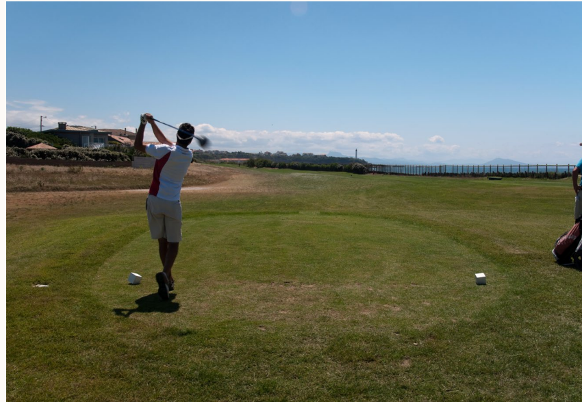
Golf de Chiberta 104 Bd des Plages, 64600 Anglet