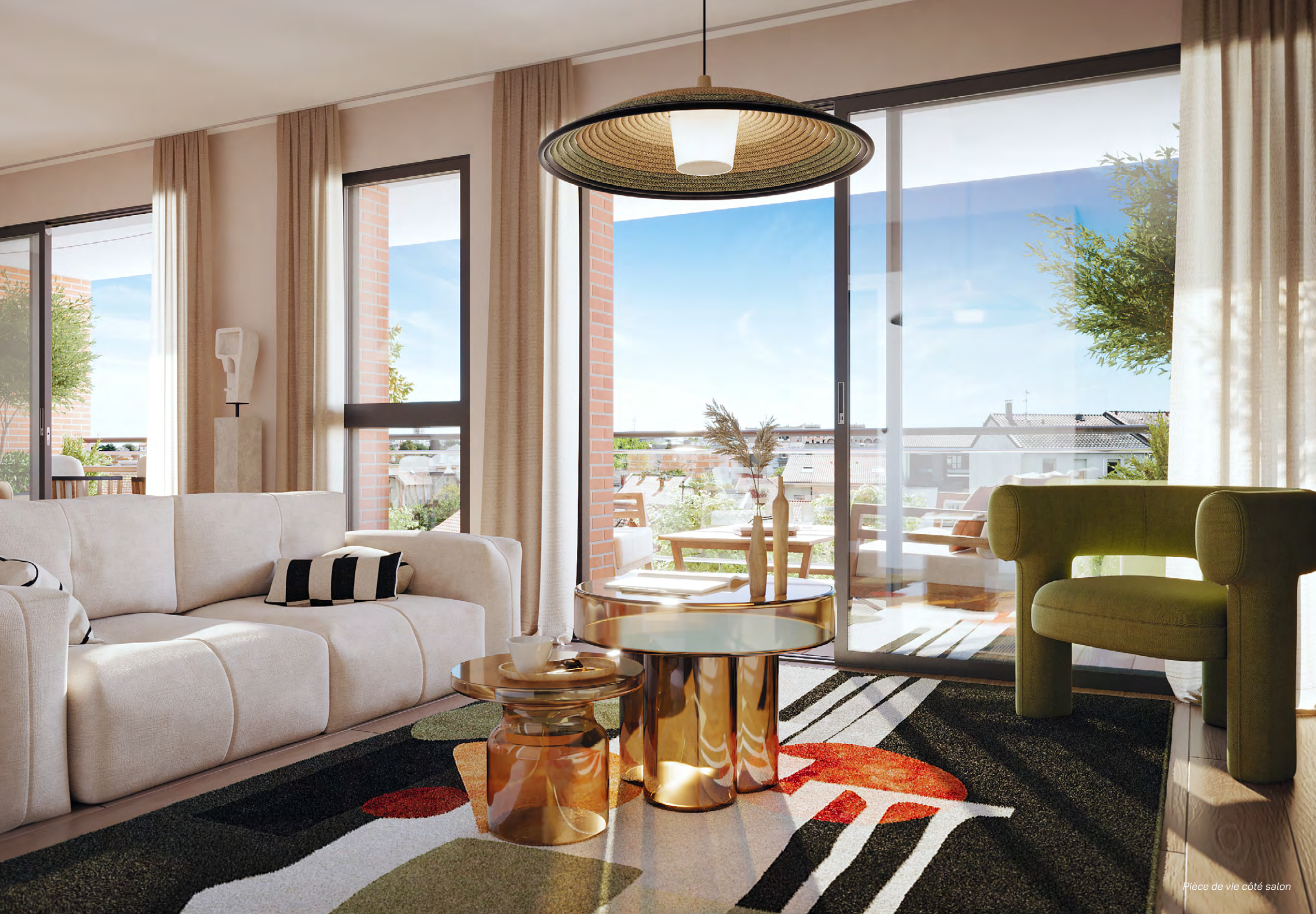
Pièce de vie côté salon