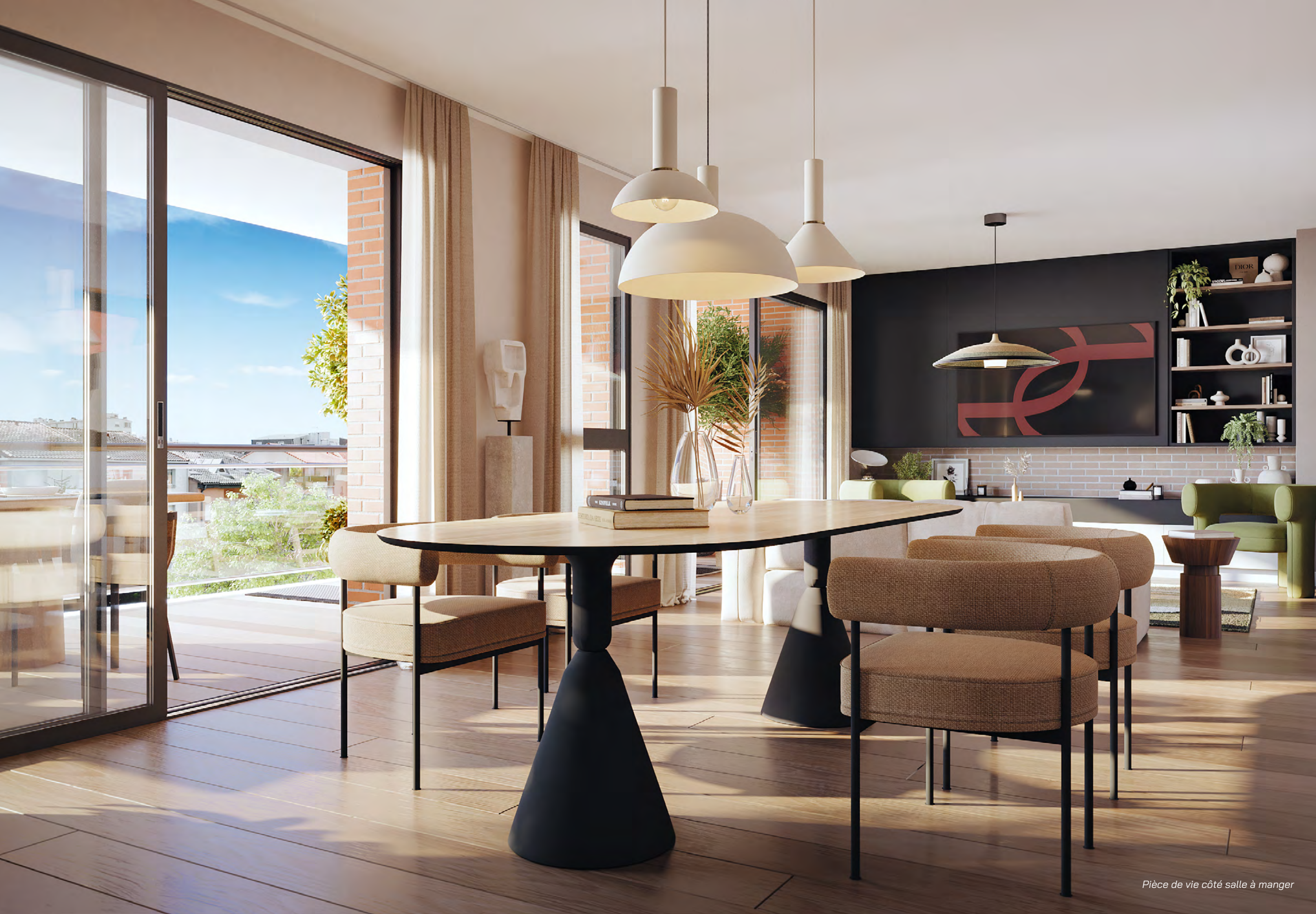
Pièce de vie côté salle à manger