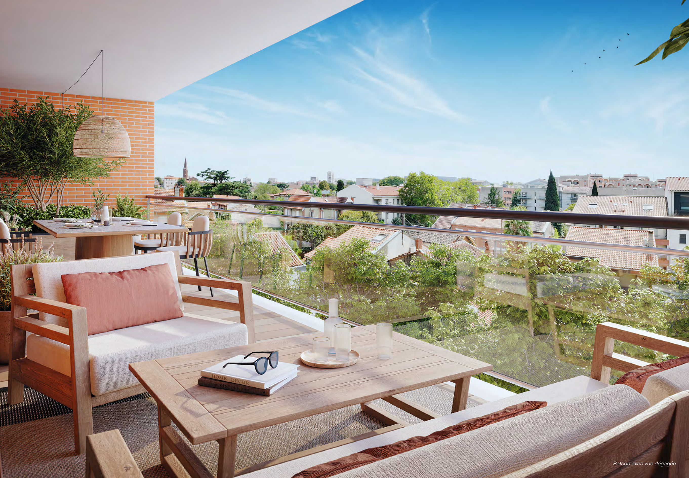
Balcon avec vue dégagée