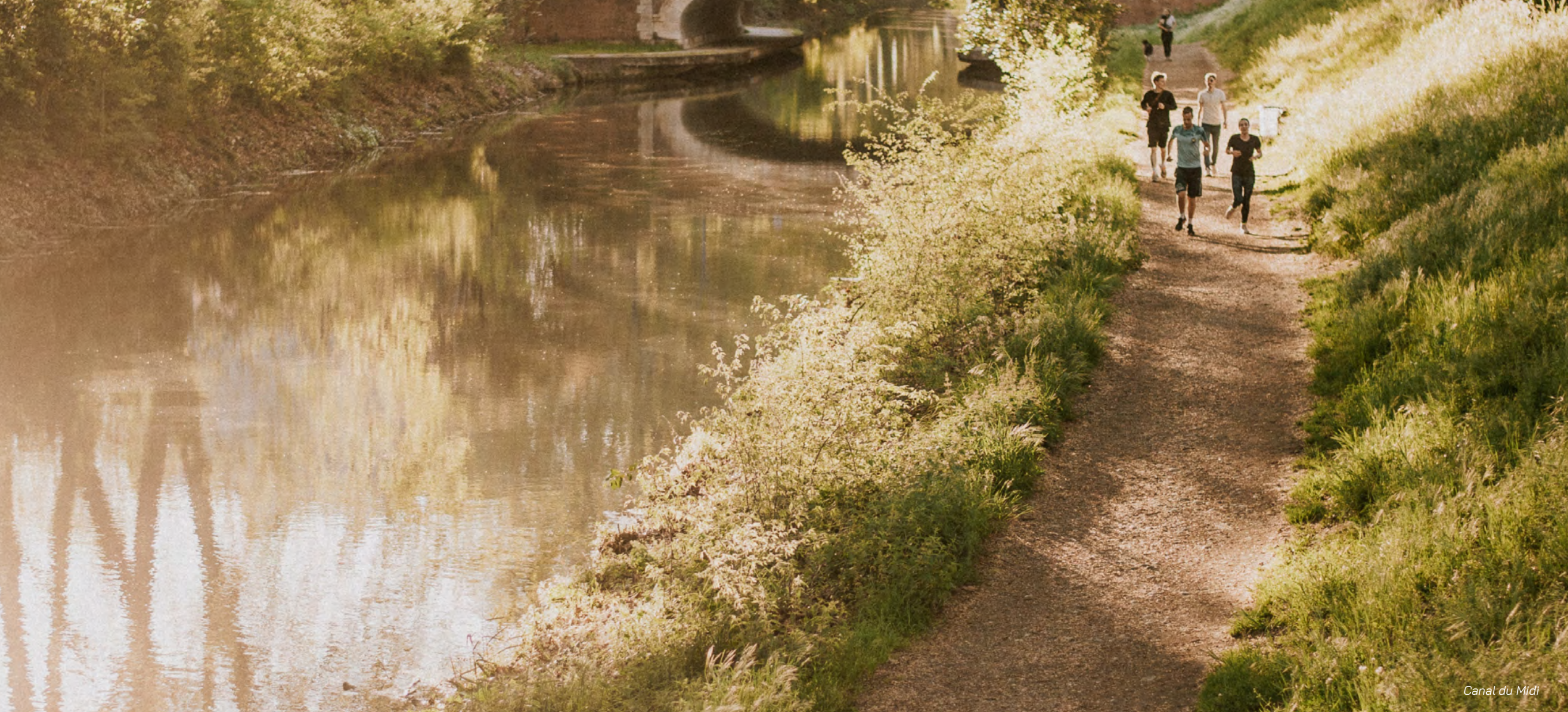
Canal du Midi