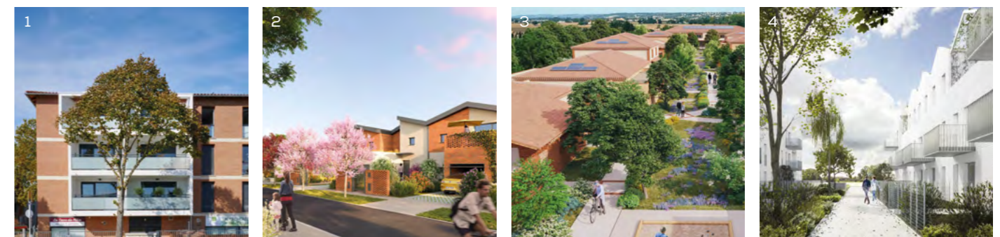
1/ Résidence Bel Ange – Saint-Jory (31) 58 logements / Livraison : 2021