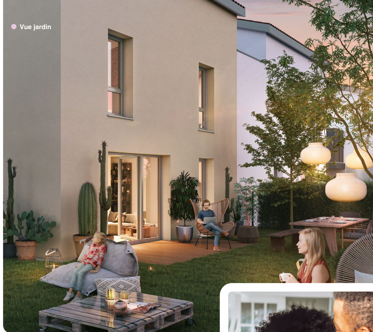
● Vue jardin