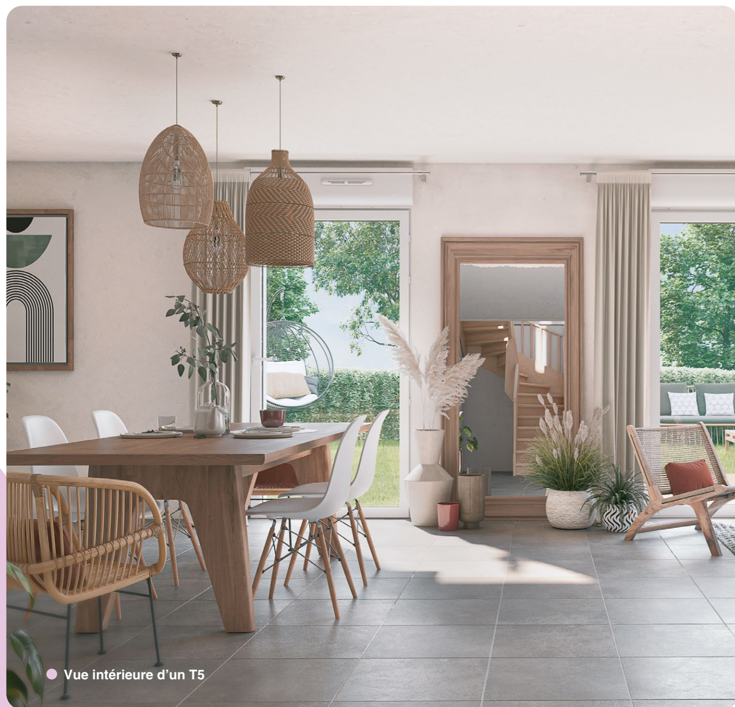
● Vue intérieure d'un T5