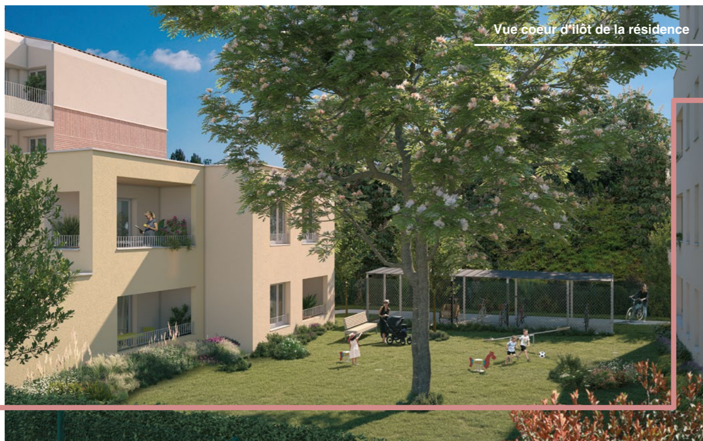
Vue cœur d'îlot de la résidence