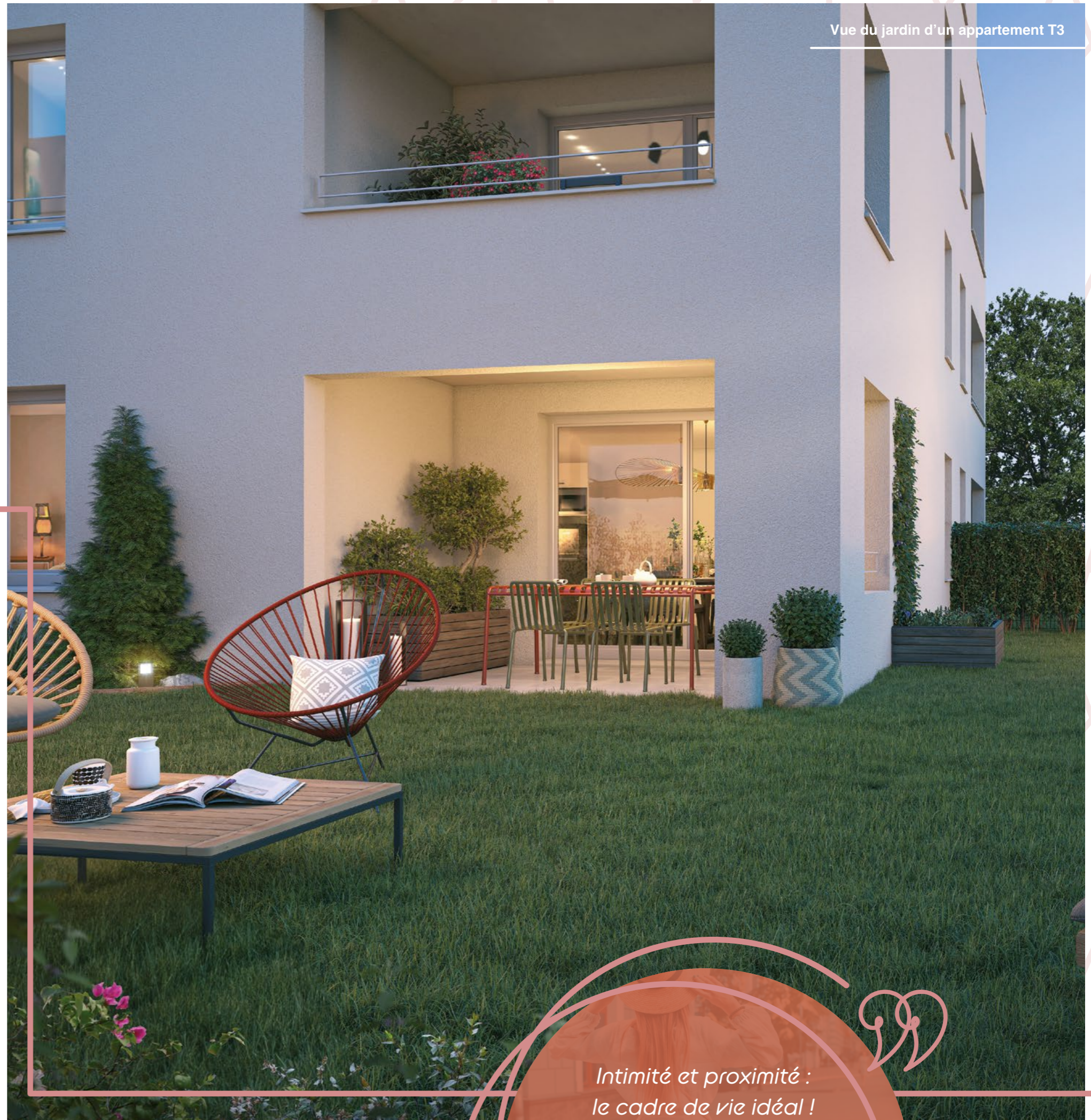
Vue du jardin d'un appartement T3