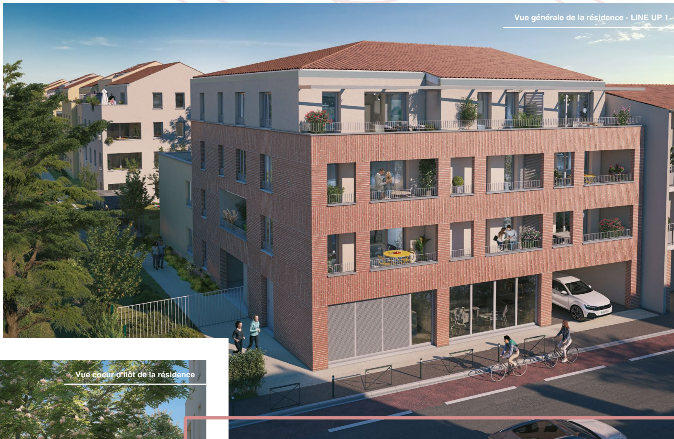
Vue générale de la résidence - LINE UP 1

Pour ceux qui cherchent un moment de calme, le lac de Gironis, situé à proximité, constitue un havre de paix et de verdure au sein du quartier. N'attendez plus pour découvrir votre futur logement au sein de la résidence Line Up !