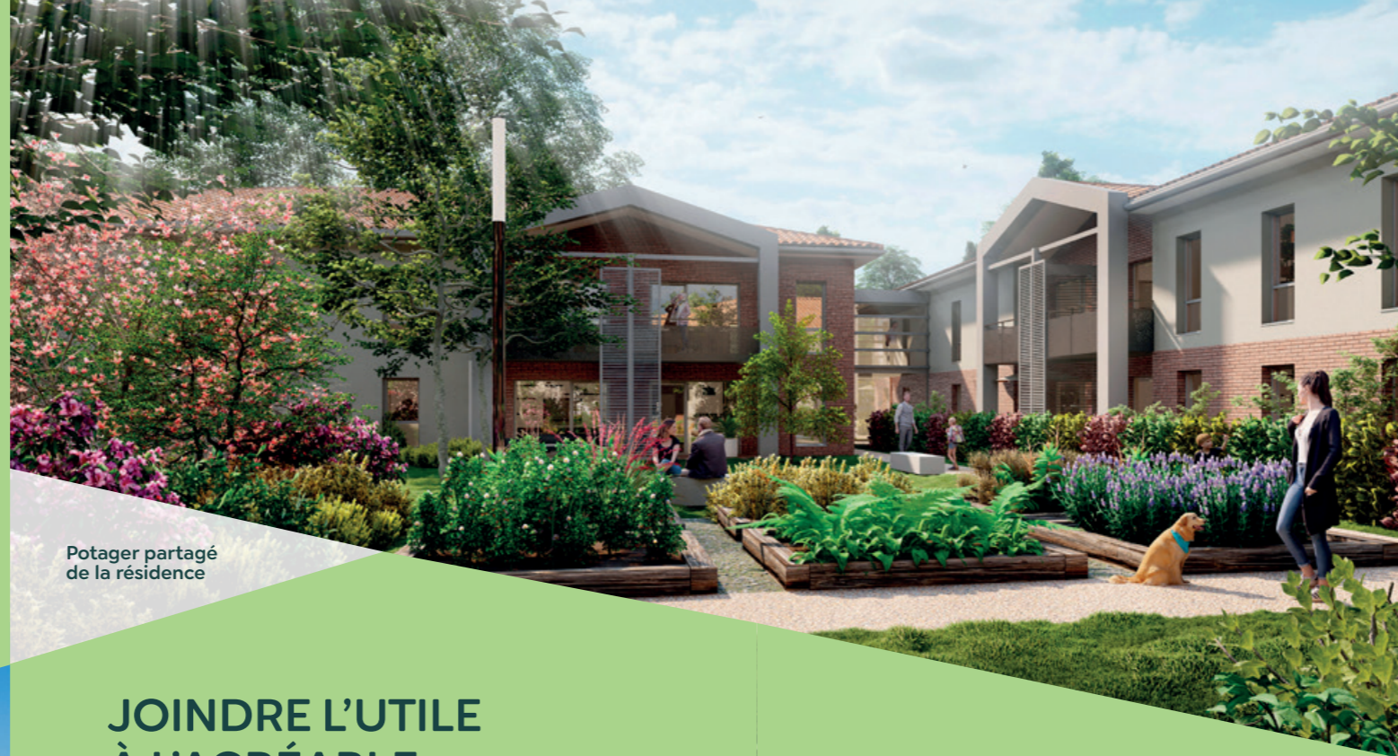
Potager partagé de la résidence