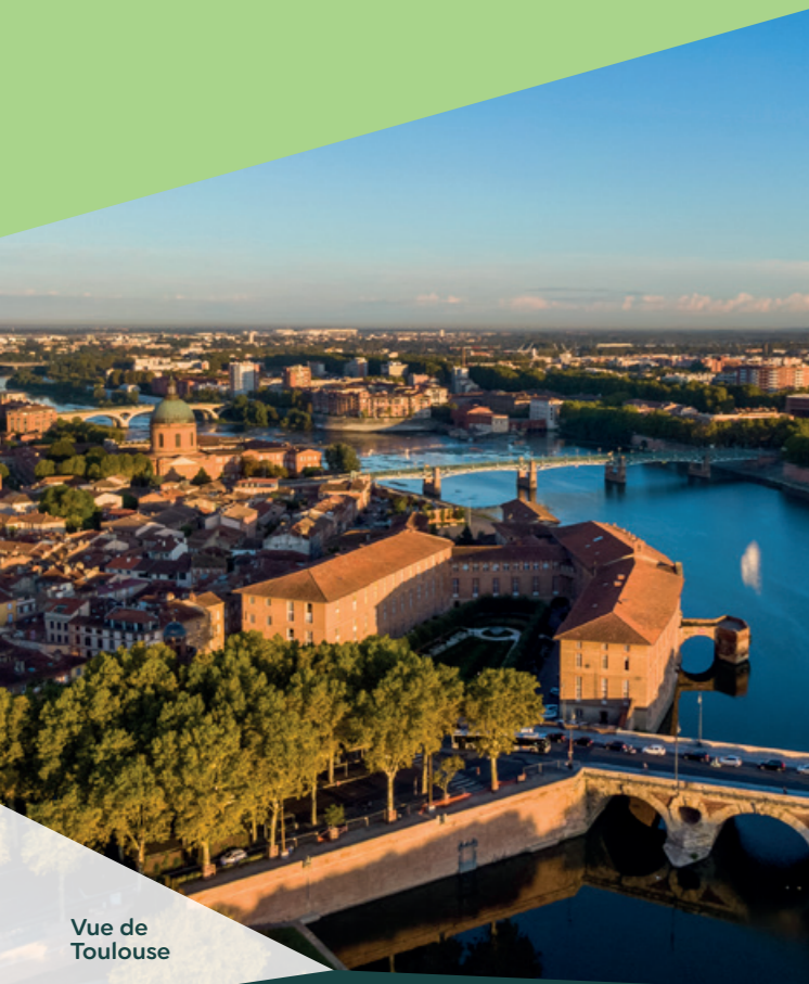
Vue de Toulouse

En son centre, un parc paysager accessible invite à la rêverie et à l'évasion. Orné d'arbres, d'arbustes et de haies végétalisées, cet espace vert à forte valeur écologique et sociale constitue une véritable source de bien-être. On y trouve également un potager partagé où tous les habitants pourront cultiver leurs légumes et plantes aromatiques. Une diversité végétale qui garantit un paysage unique et qui répond aux actuelles préoccupations environnementales.