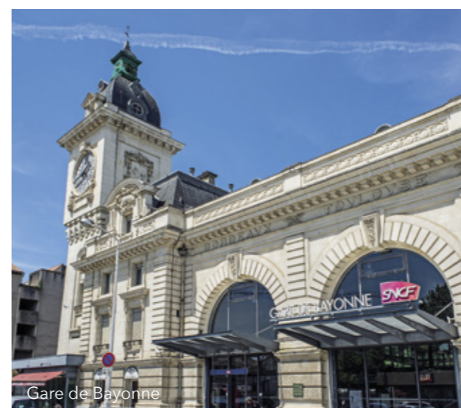
Gare de Bayonne