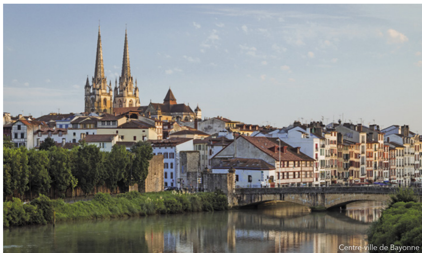
Centre-ville de Bayonne