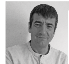
Denis Marty Architecte

Comme une émergence le long de la rue Maubec à Bayonne, la résidence Akoya vient s'intégrer, se modeler au contexte urbain à typologie et topographie contrastée. Les épaulements créés pour adoucir les proximités des voisinages offre une richesse volumétrique et architecturale à ce bâtiment.