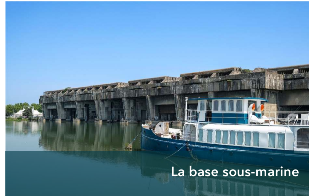
La base sous-marine