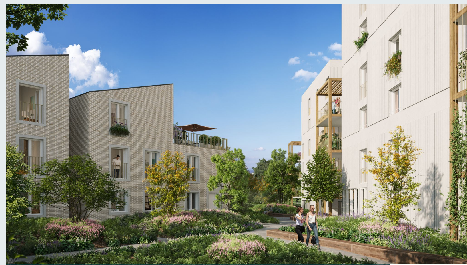
Latitude 270 - FLOIRAC