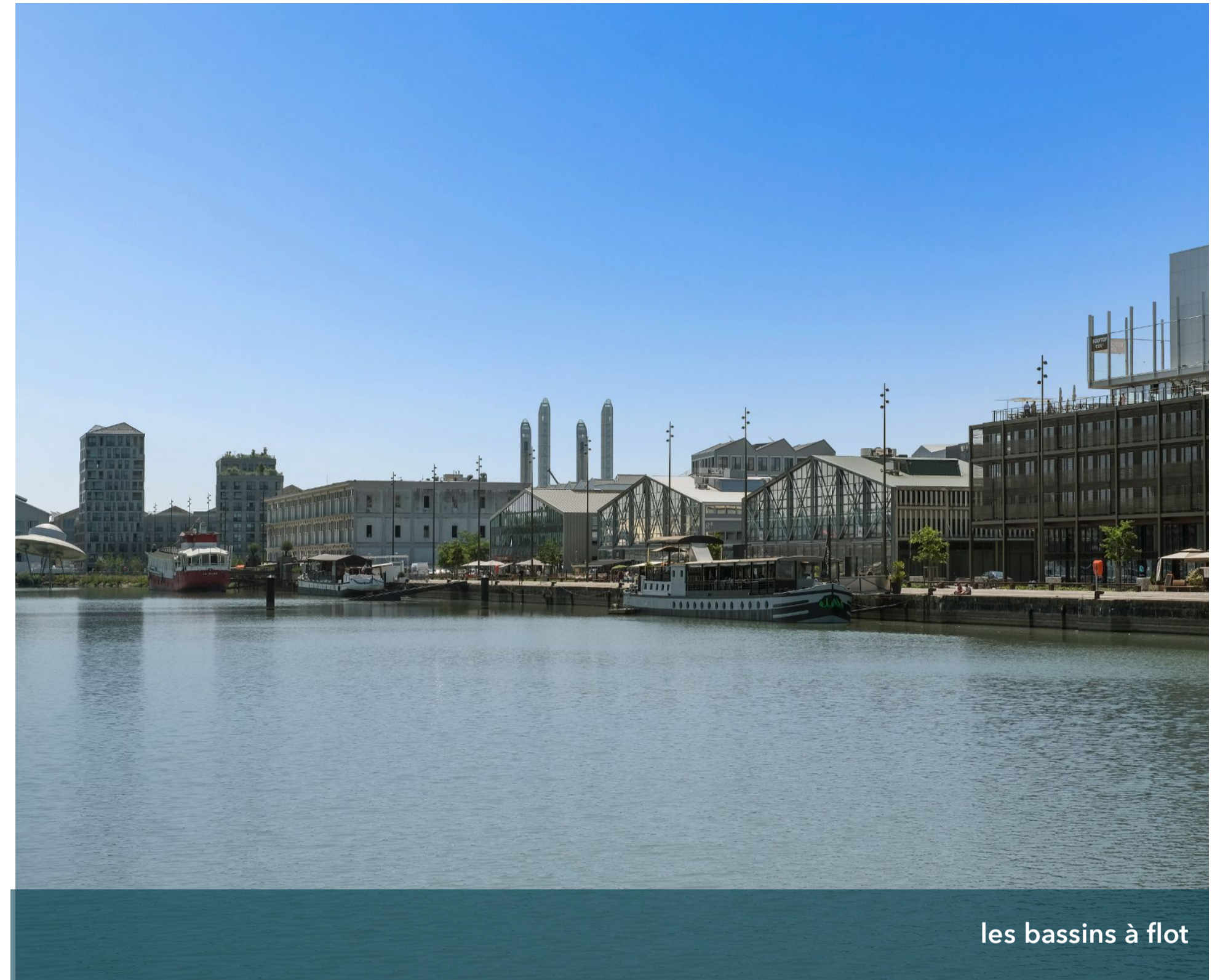
les bassins à flot