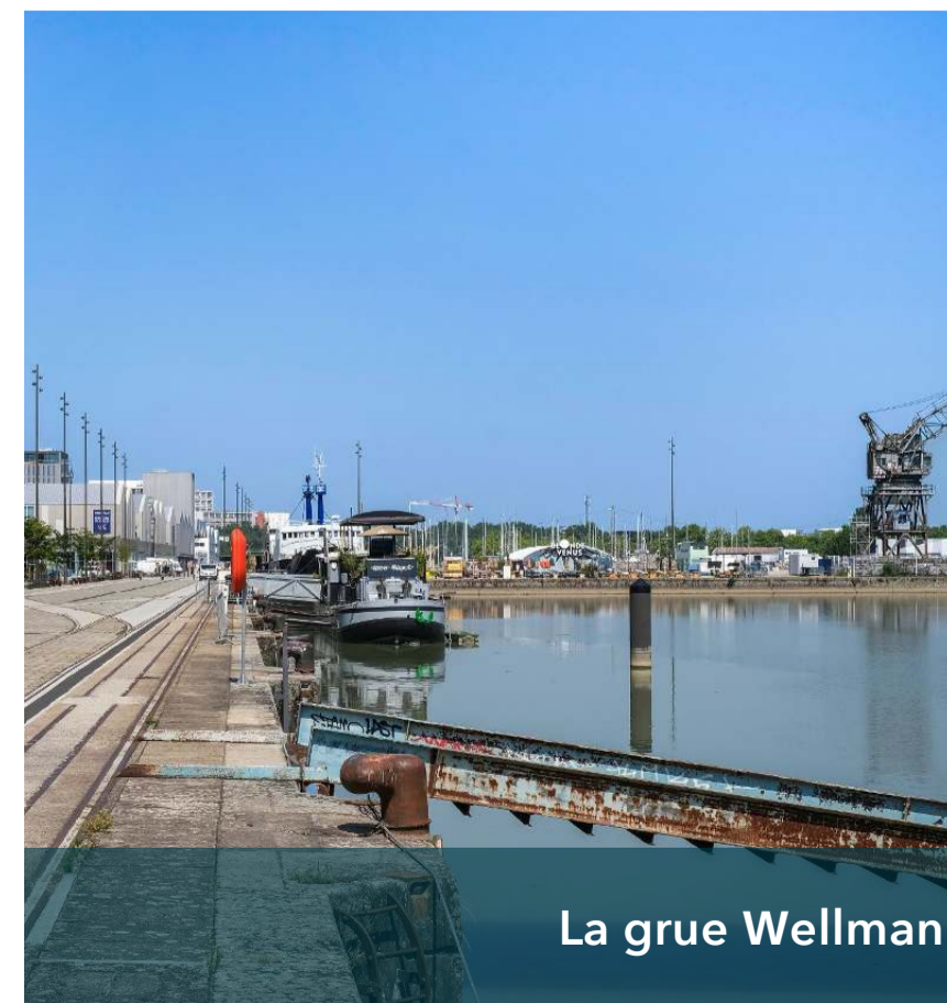
La grue Wellman