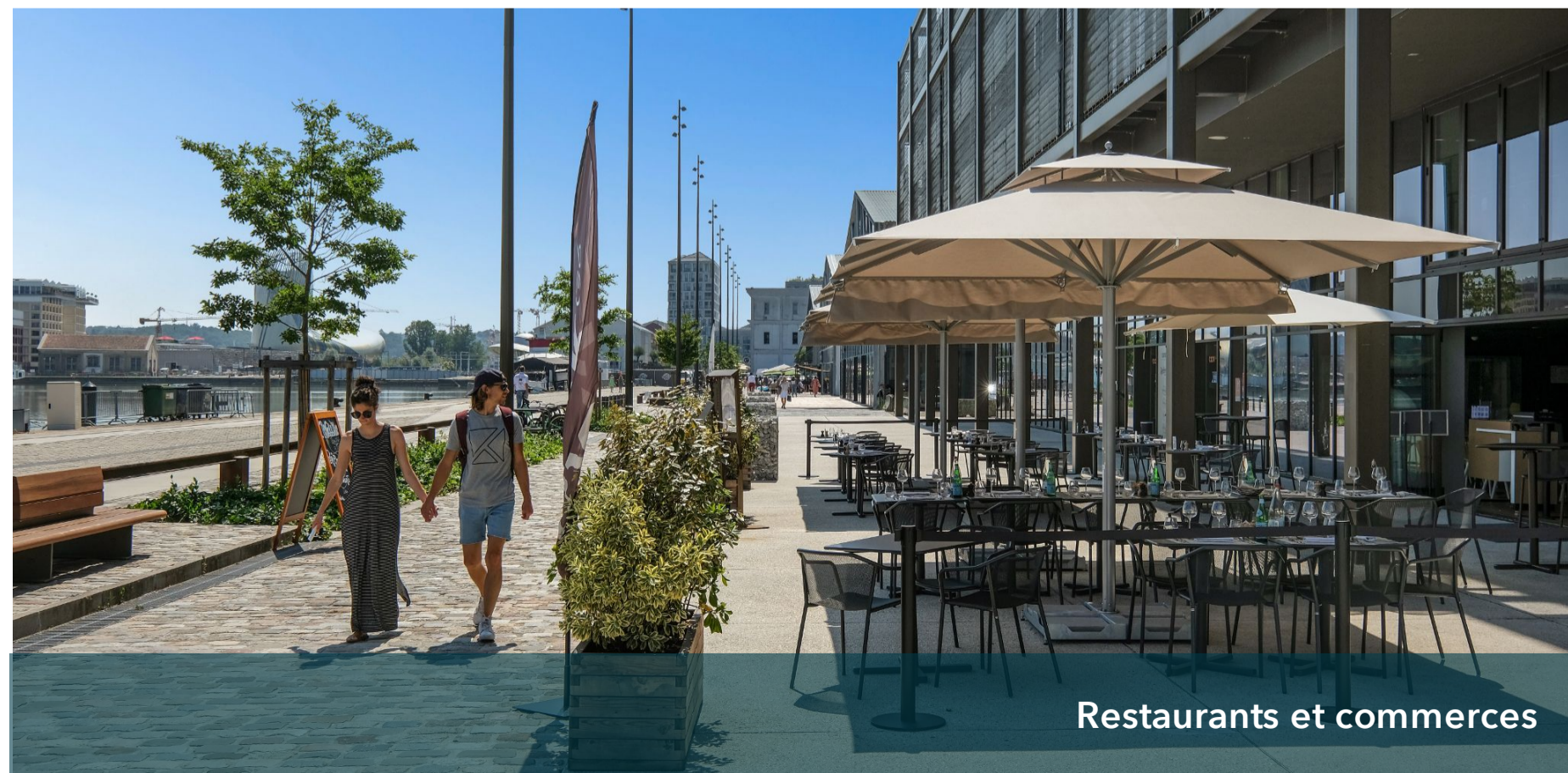
Restaurants et commerces