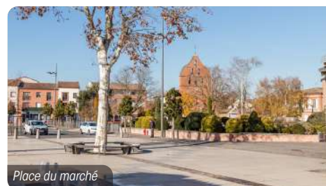
Place du marché