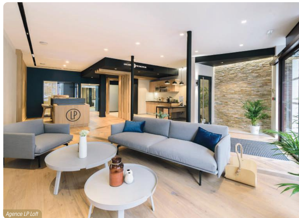
Agence LP Loft