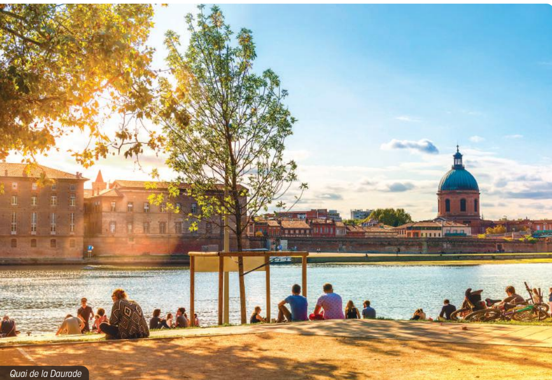
Quai de la Daurade