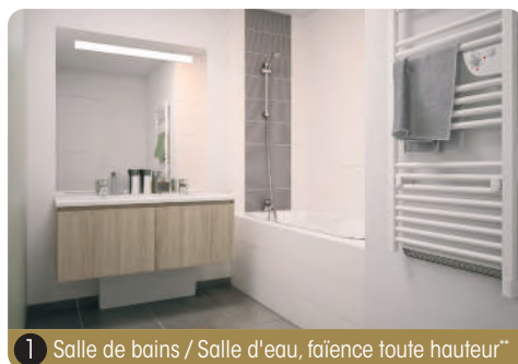
1 Salle de bains / Salle d'eau, faïence toute hauteur**