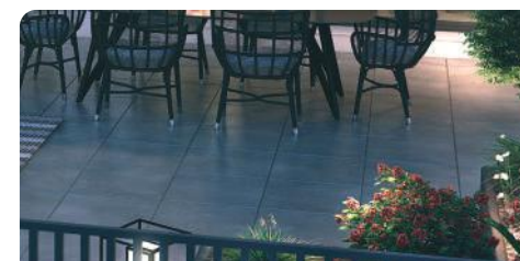
11 Terrasses RDC en lames bois, terrasses au dernier étage en dalles carrelage 60x60 cm, balcons et loggias en résine époxy