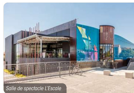
Salle de spectacle L'Escale