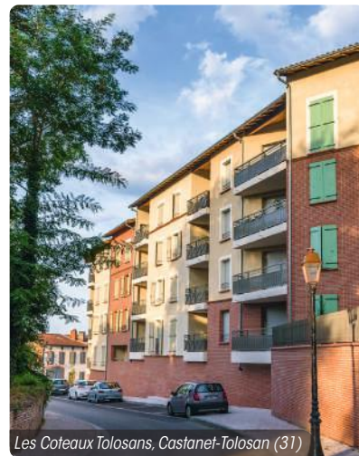
Les Coteaux Tolosans, Castanet-Tolosan (31)