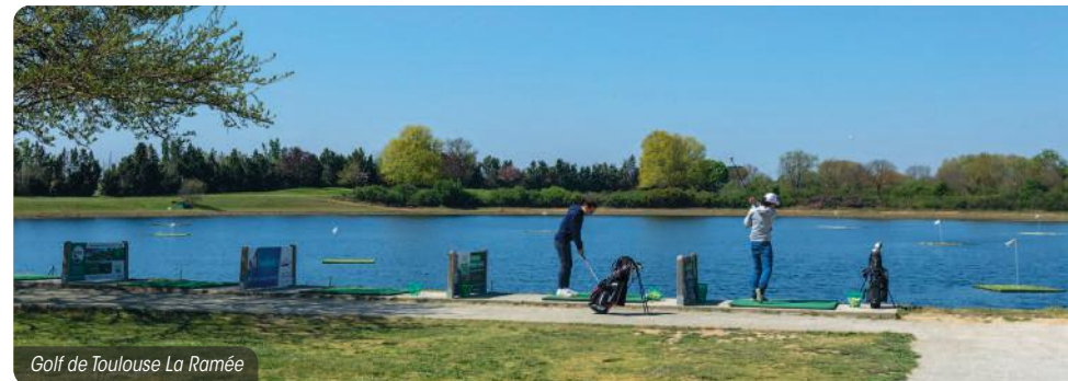
Golf de Toulouse La Ramée

Enfin, pour les promenades bucoliques ou sportives, la résidence est également non loin de la coulée verte longeant Le Touch et de la base de loisirs de La Ramée avec ses 250 hectares de verdure, ses 4 lacs, son golf et ses équipements nautiques.