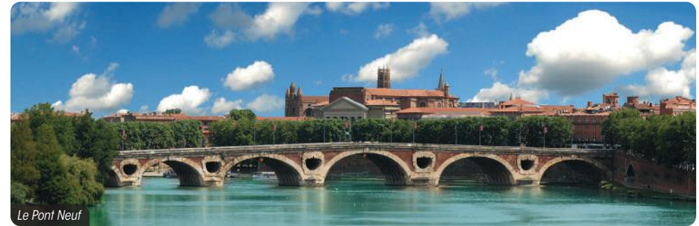
Le Pont Neuf