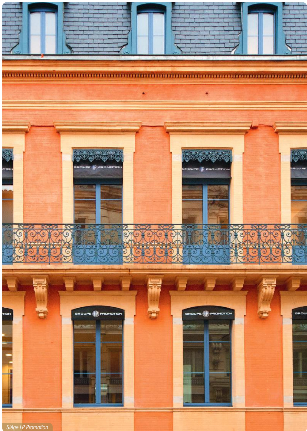
Siège LP Promotion