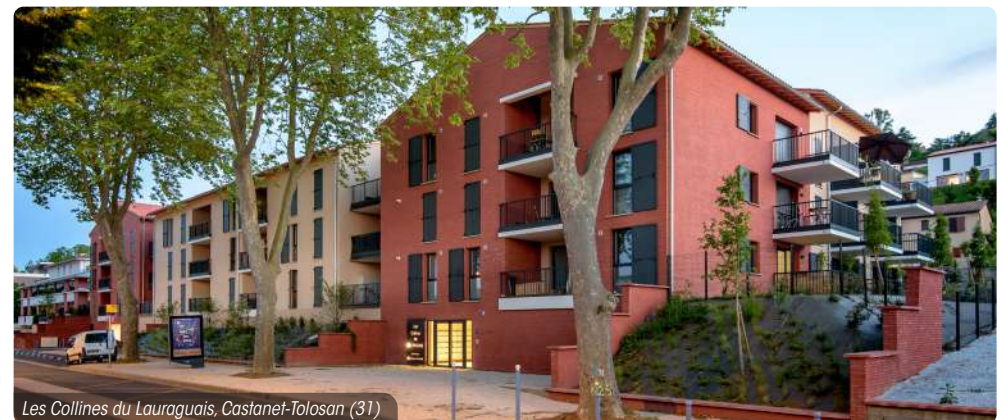
Les Collines du Lauragais, Castanet-Tolosan (31)

Document et illustrations non contractuels.