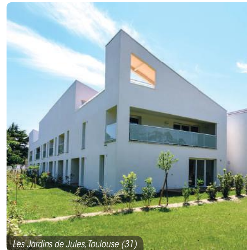
Les Jardins de Jules, Toulouse (31)