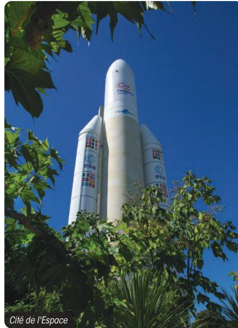
Cité de l'Espace