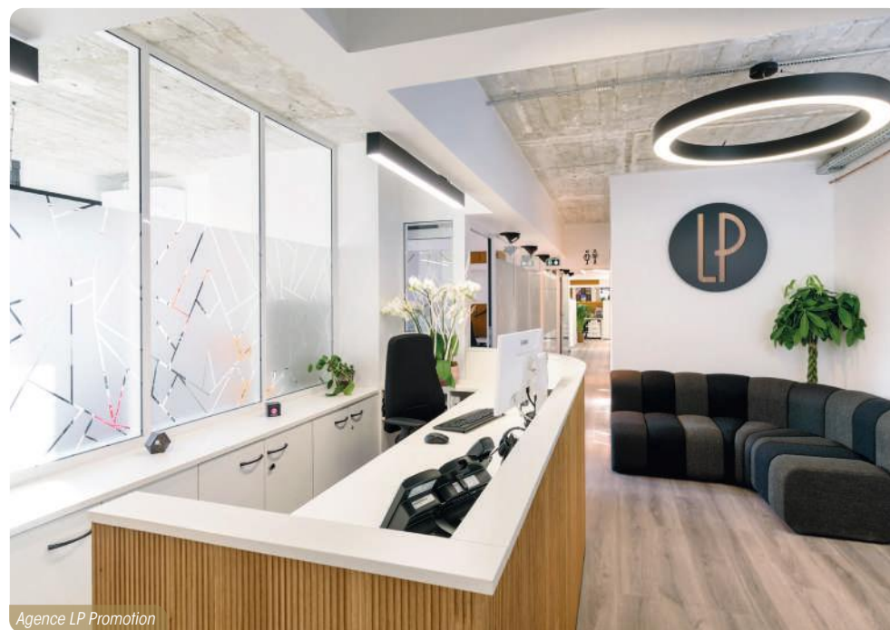
Agence LP Promotion