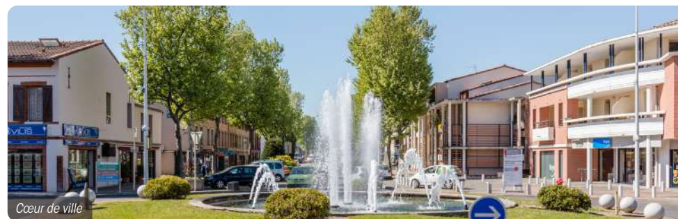
Cœur de ville