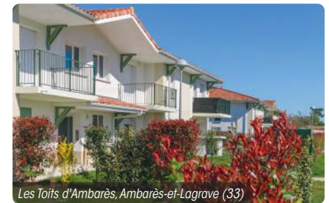
Les Toits d'Ambarès, Ambarès-et-Lagrave (33)