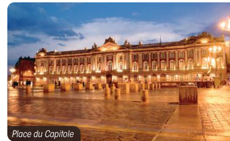
Place du Capitole