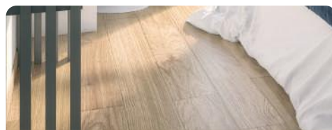
3 Sol stratifié chanfreiné dans les chambres

** Au droit de la douche et/ou de la baignoire.