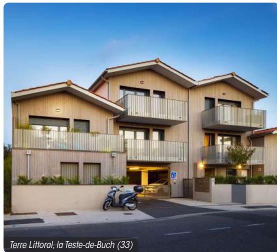
Terre Littoral, la Teste-de-Buch (33)