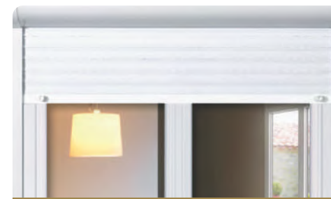
10 Volet roulant électrique dans le séjour