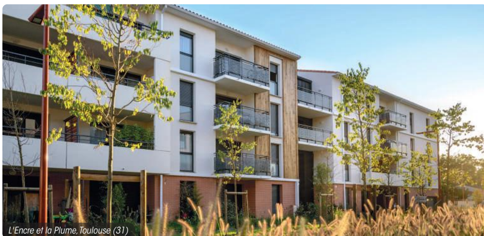
L'Encre et la Plume, Toulouse (31)