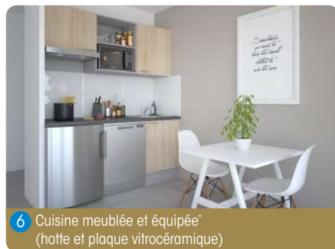
6 Cuisine meublée et équipée* (hotte et plaque vitrocéramique)