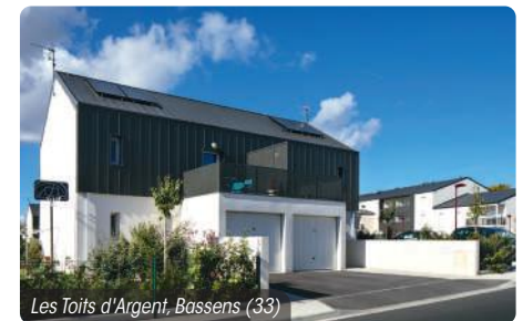
Les Toits d'Argent, Bassens (33)