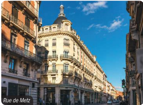
Rue de Metz