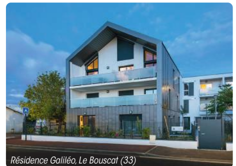
Résidence Galiléo, Le Bouscat (33)

Service Marketing Groupe LP Promotion. Mars 2023. Imprimé en France sur du papier issu de forêts gérées durablement. Imprimeur labellisé Imprim'Vert.