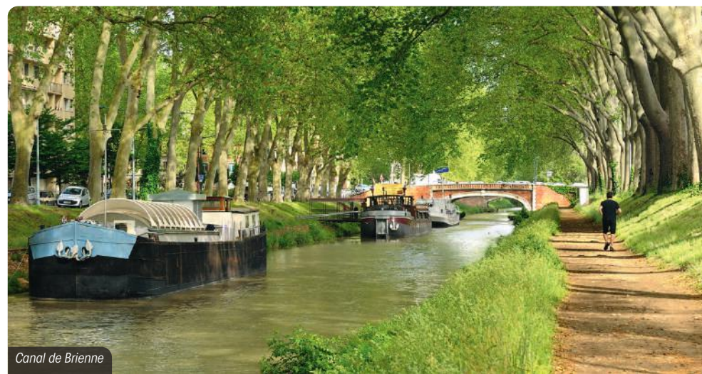
Canal de Brienne