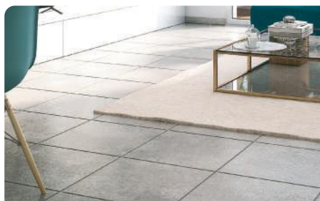
7 Carrelage 45x45 cm pour les T2 et T3 et 60x60 cm pour les T4