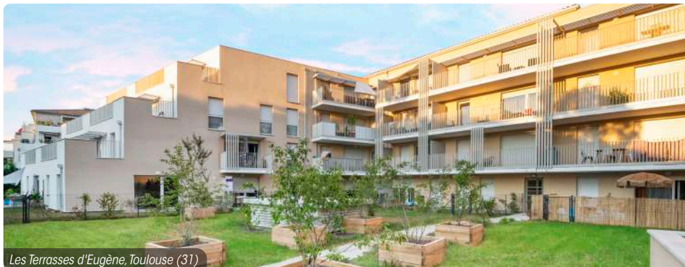
Les Terrasses d'Eugène, Toulouse (31)