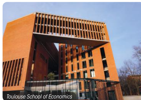
Toulouse School of Economics