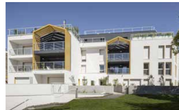
Les Terrasses de Saint-Augustin à Mérignac (33) Architecte : Agence d'architecture URBIN