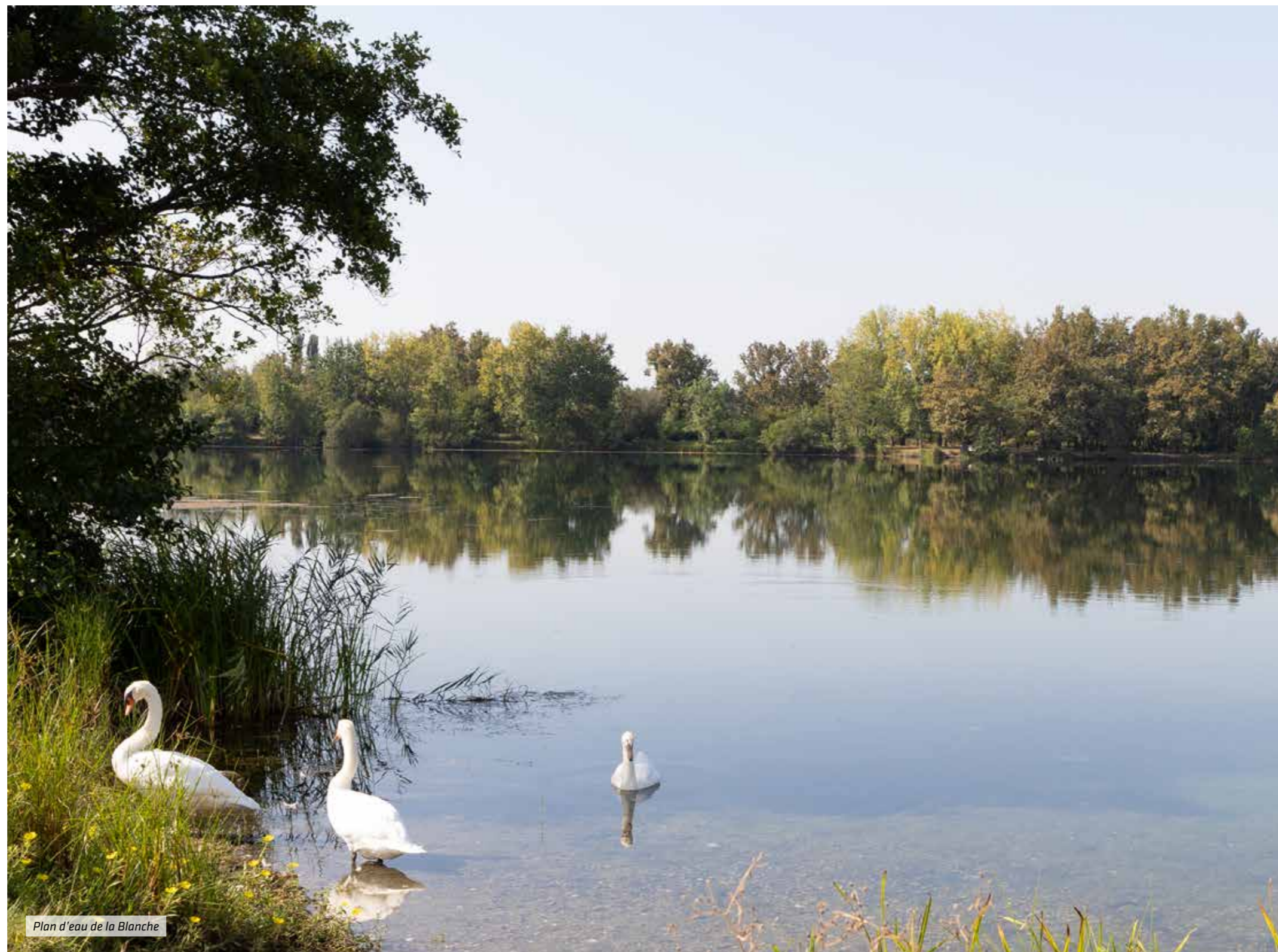
Plan d'eau de la Blanche

Participent à un quotidien serein : commerces, marché et grandes enseignes pour les courses ; crèches et écoles où les enfants s'épanouissent ; équipements de loisirs variés donnant des ailes aux passions. Sans compter les projets dédiés à l'embellissement permanent de votre futur cadre de vie !