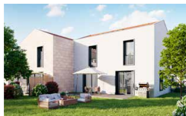
Villa Brugeaise à Bruges (33) Architecte : Atelier Alonso Sarraute