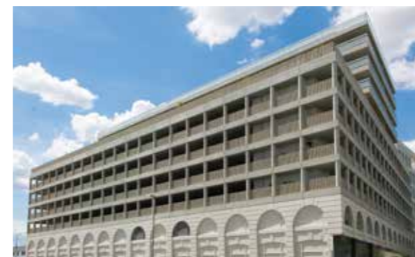
Attique de Brienne à Bordeaux (33) Architecte : Colboc Sachet architecture