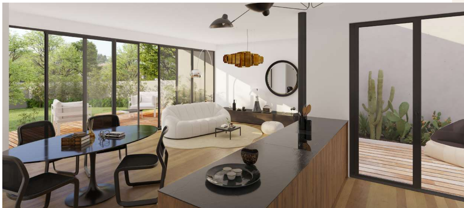
Proposition d'aménagement intérieur d'une maison de plain-pied avec patio.