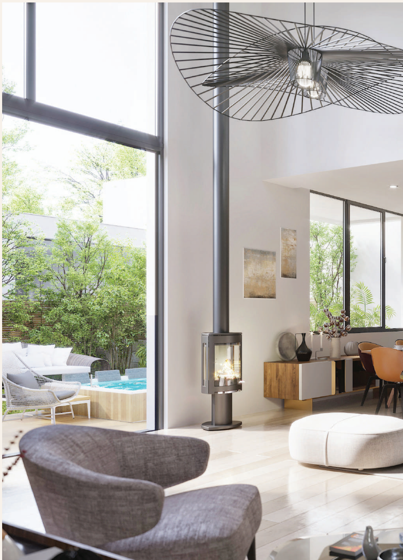
Proposition d'aménagement intérieur d'une maison.