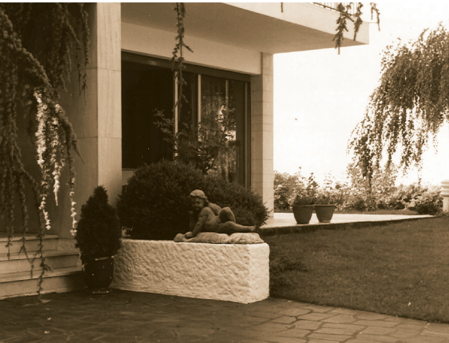
Archive familiale, juin 1991.