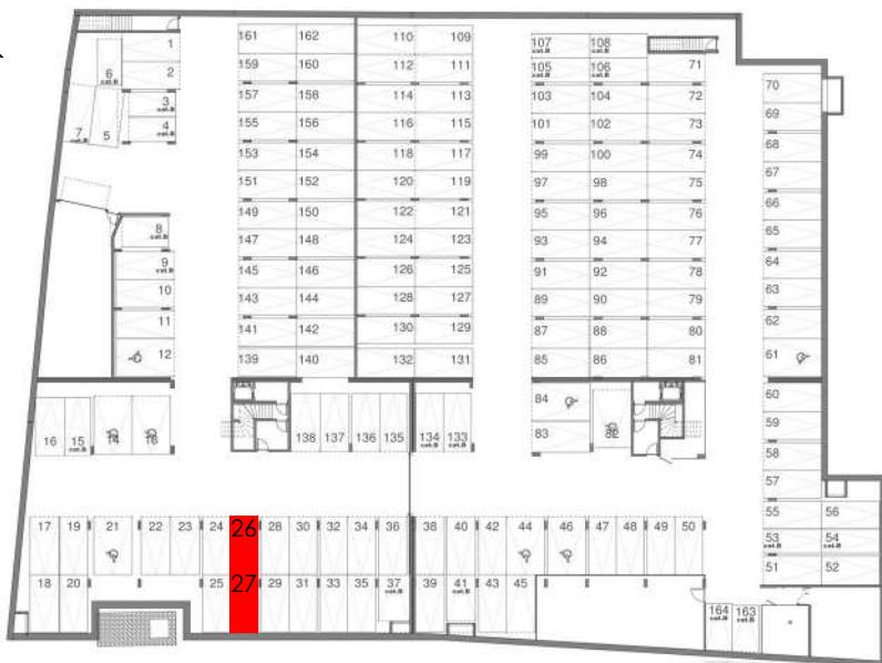
REPERAGE PARKINGS SOUS-SOL