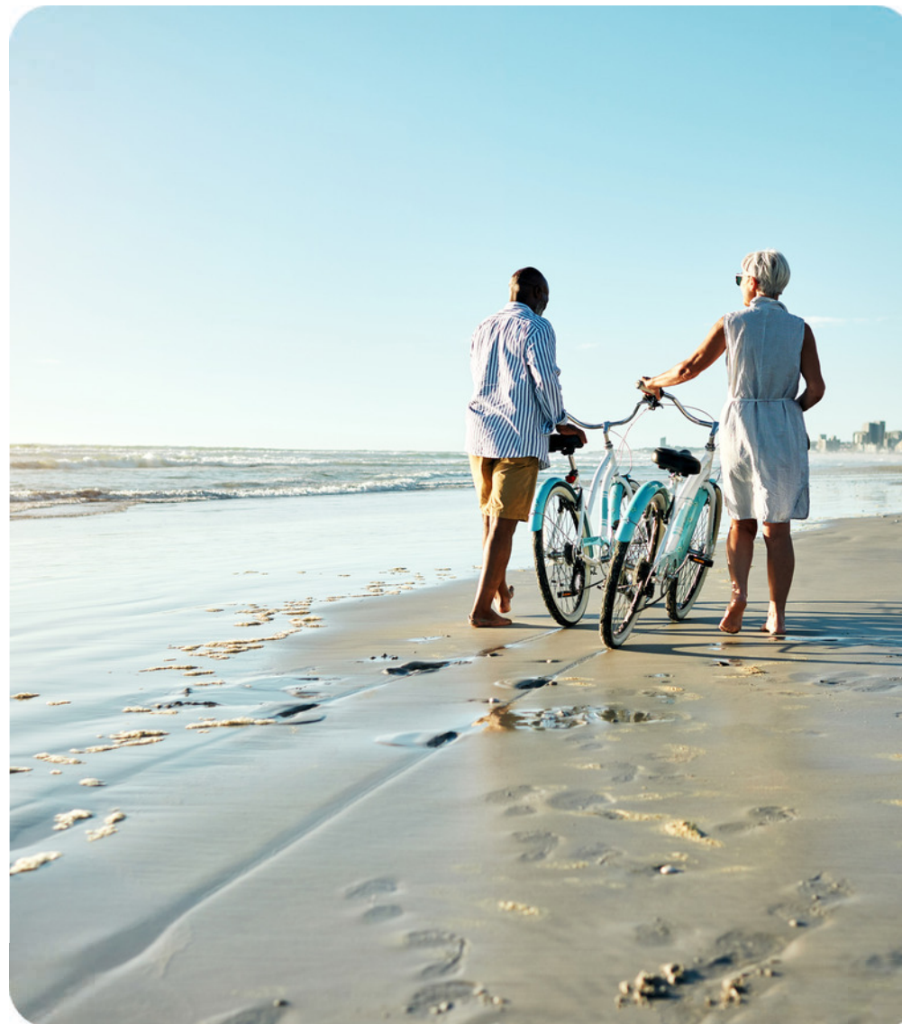
Un cadre de vie privilégié

La Villa Midway propose un environnement de vie exceptionnel dont vous pourrez jouir toute l'année.