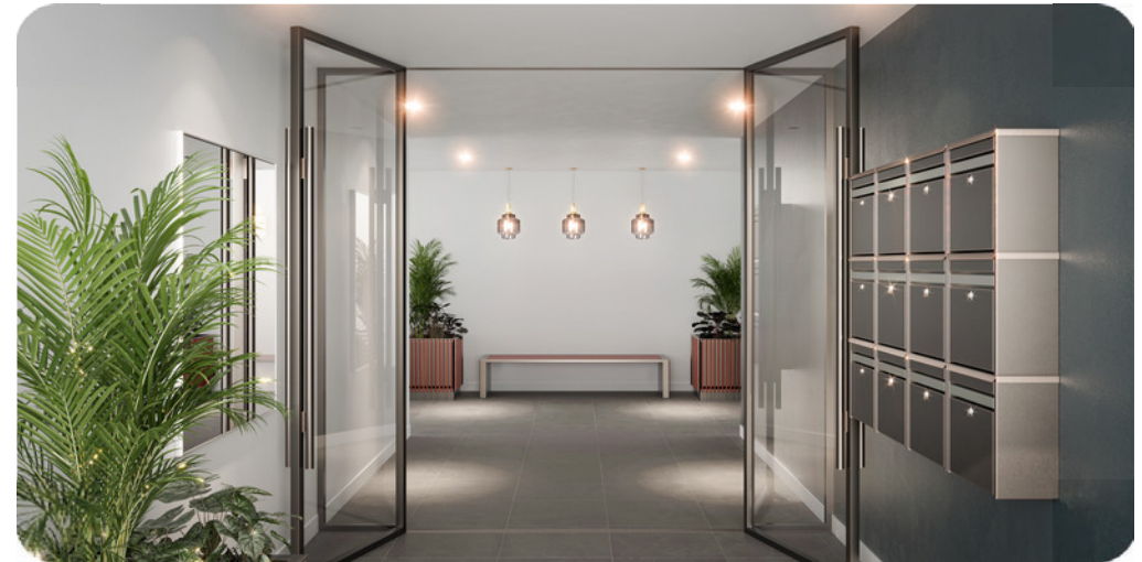
Exemple de hall sécurisé

46 Avenue du Maréchal Leclerc 40130 CAPBRETON