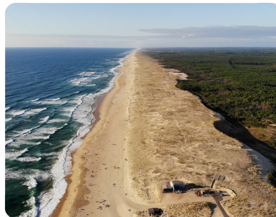
Plages des Landes

Recouvert à 65 % par la forêt, le département des Landes est un vrai paradis pour les randonneurs et tous les amoureux de la nature. Lacs, forêts, plages, dunes... vous profitez de paysages exceptionnels à admirer tout au long de l'année.