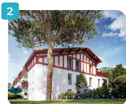
Vue cœur d'îlot