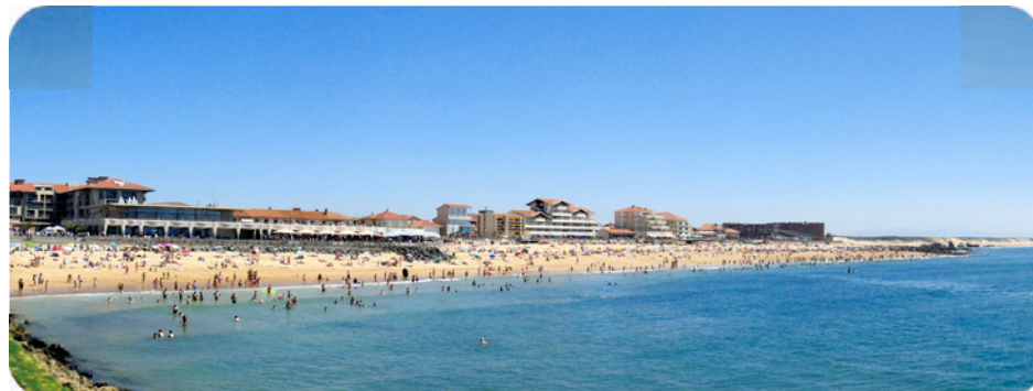
Plage de Capbreton

Voies vertes, pistes cyclables, 10 km de sentiers