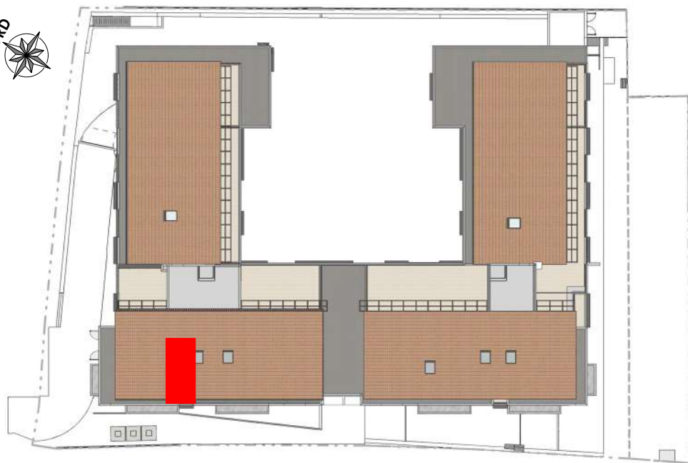
REPERAGE PLAN DE MASSE