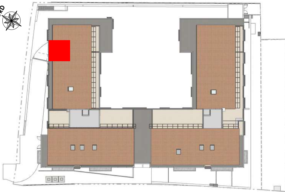
REPERAGE PLAN DE MASSE