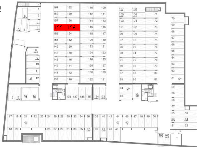
REPERAGE PARKINGS SOUS-SOL