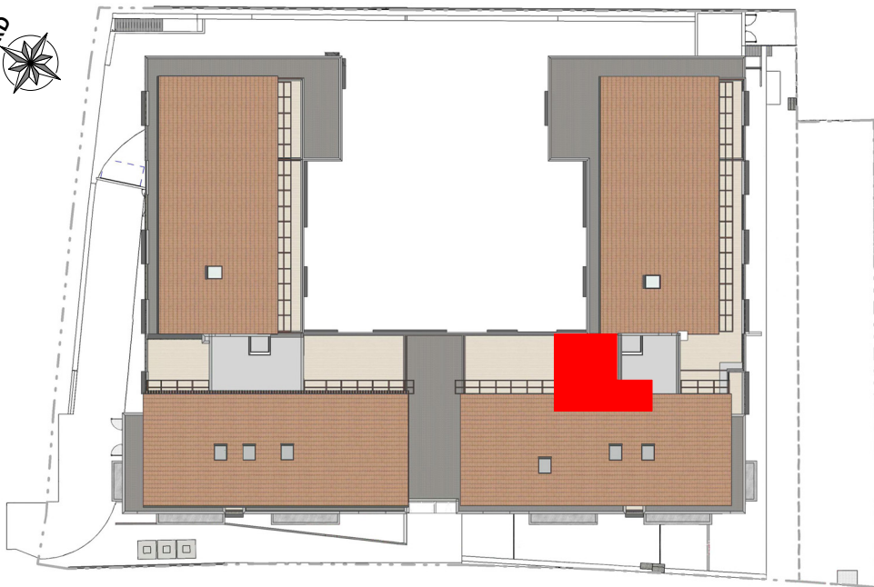
REPERAGE PLAN DE MASSE