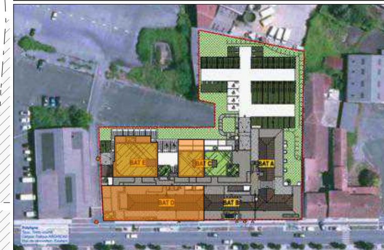
Plan de MASSE : Phase 2

132 à 142 Avenue Saint Vincent de Paul 40100 DAX