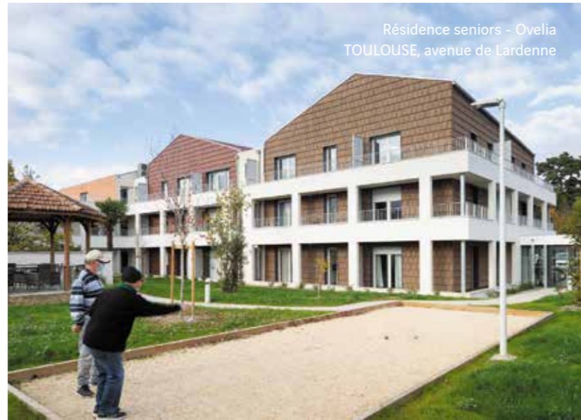
Résidence seniors - Ovelia TOULOUSE, avenue de Lardenne