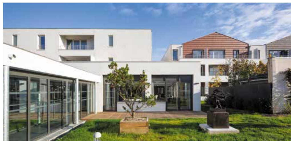
Résidence seniors - Ovelia TOULOUSE, avenue de Lardenne