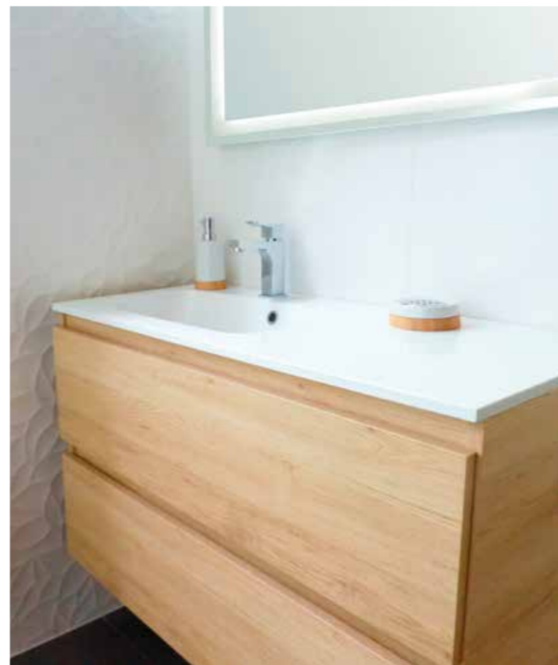
Illustration non contractuelle, à caractère d'ambiance