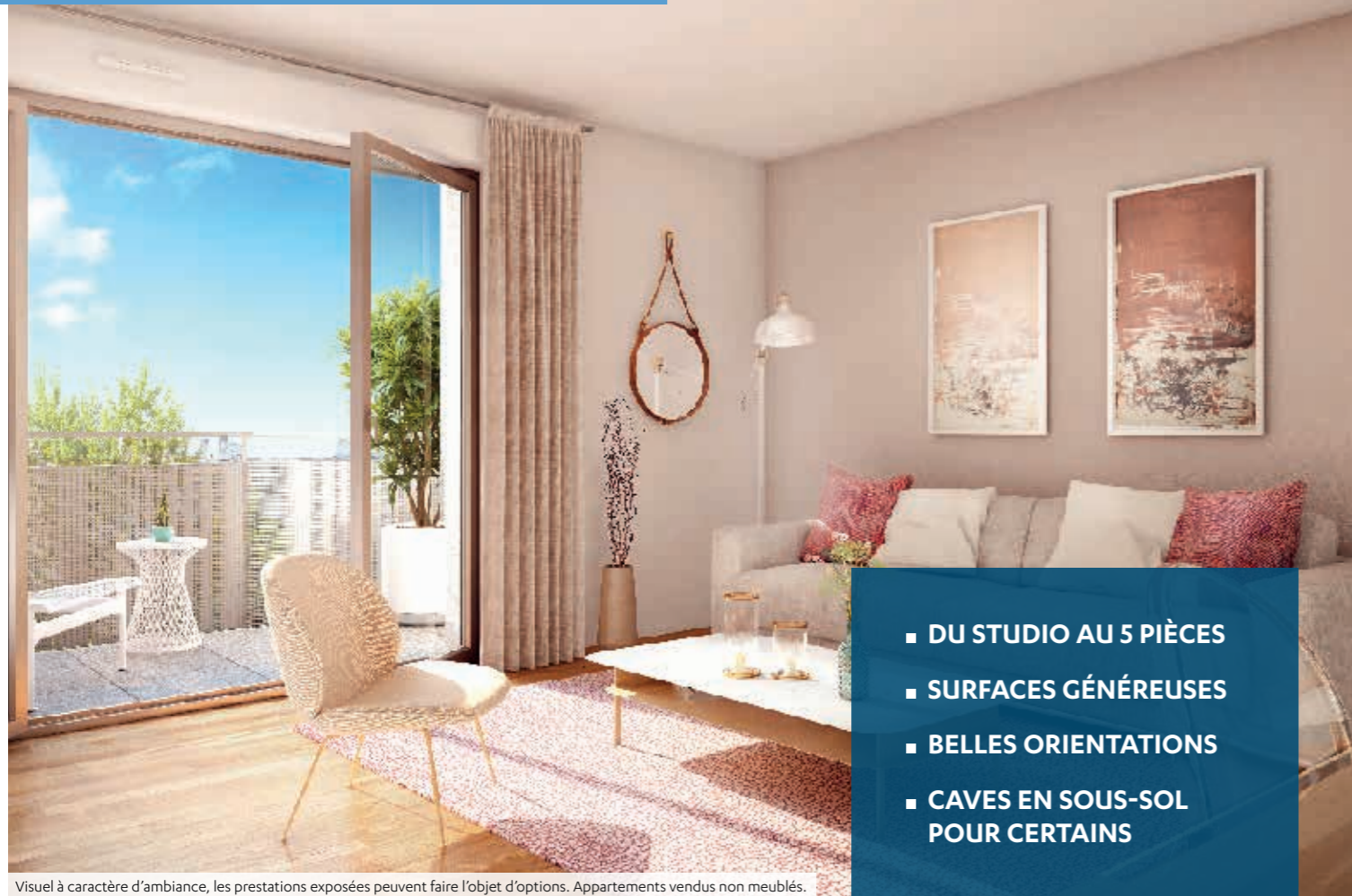
Visuel à caractère d'ambiance, les prestations exposées peuvent faire l'objet d'options. Appartements vendus non meublés.