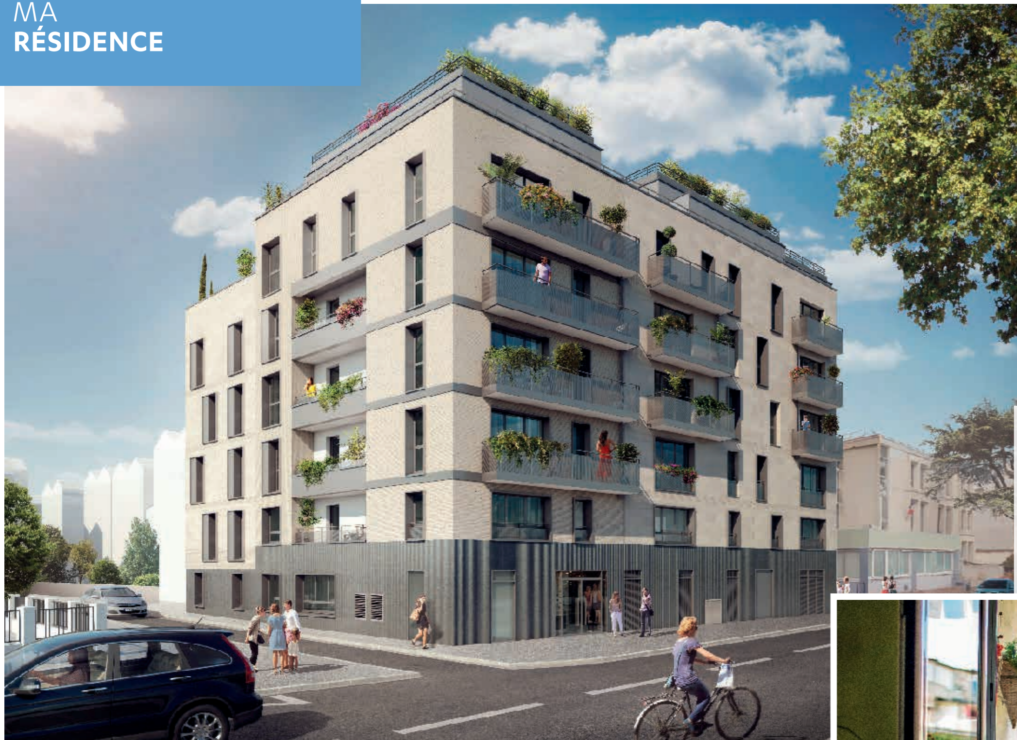
Illustration non contractuelle à caractère d'ambiance