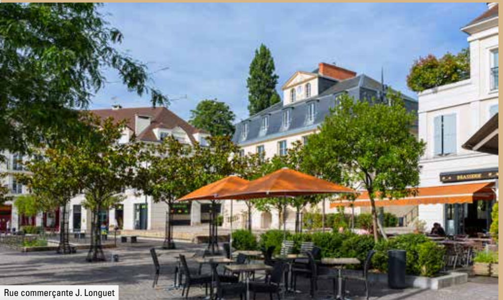
Rue commerçante J. Longuet