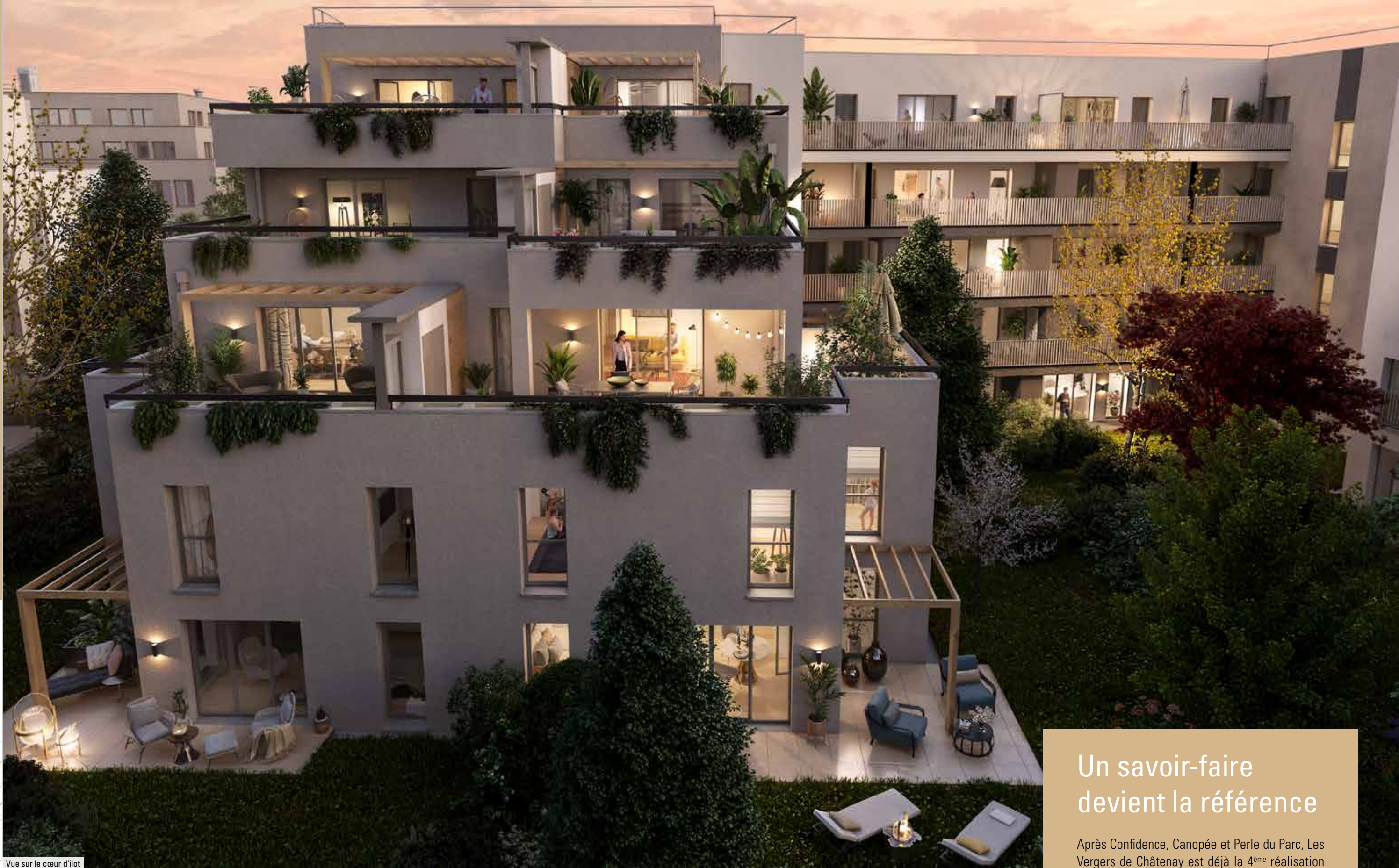
Vue sur le cœur d'îlot

C'est essentiel pour nous parce que ça l'est pour vous