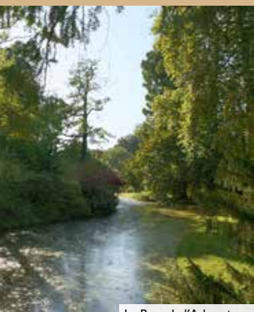
Le Parc de l'Arboretum