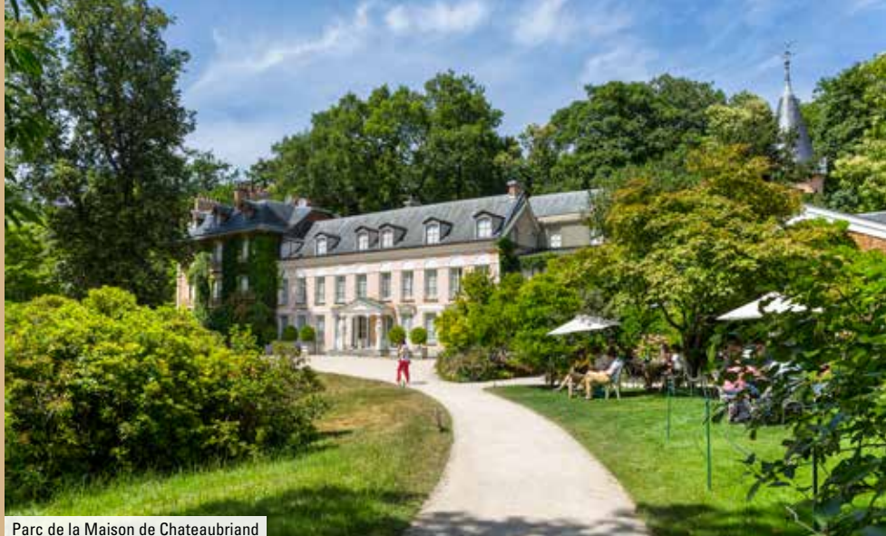
Parc de la Maison de Chateaubriand