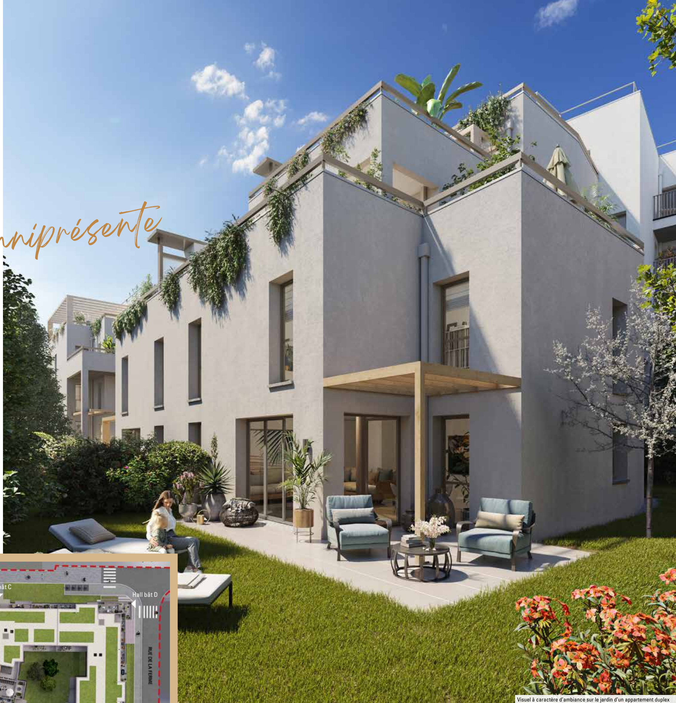
Visuel à caractère d'ambiance sur le jardin d'un appartement duplex

Pour ajouter à la tranquillité des lieux, la résidence est entièrement close et sécurisée.