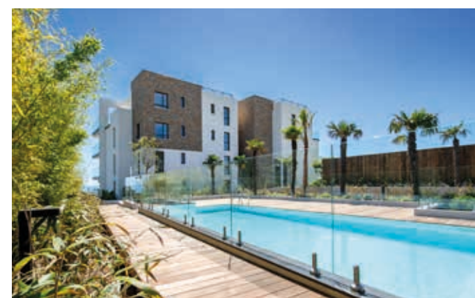
Le Panoramic - Antibes Architecte : Martial Gosselin