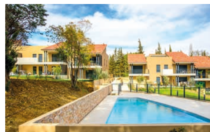
Les Jardins de la Valmasque - Mougins Architecte : ABC Architectes