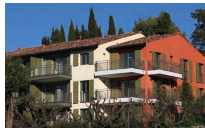
Esprit Village - Valbonne Architecte : Jean-Philippe Cabane