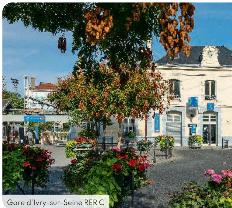
Gare d'Ivry-sur-Seine RER C