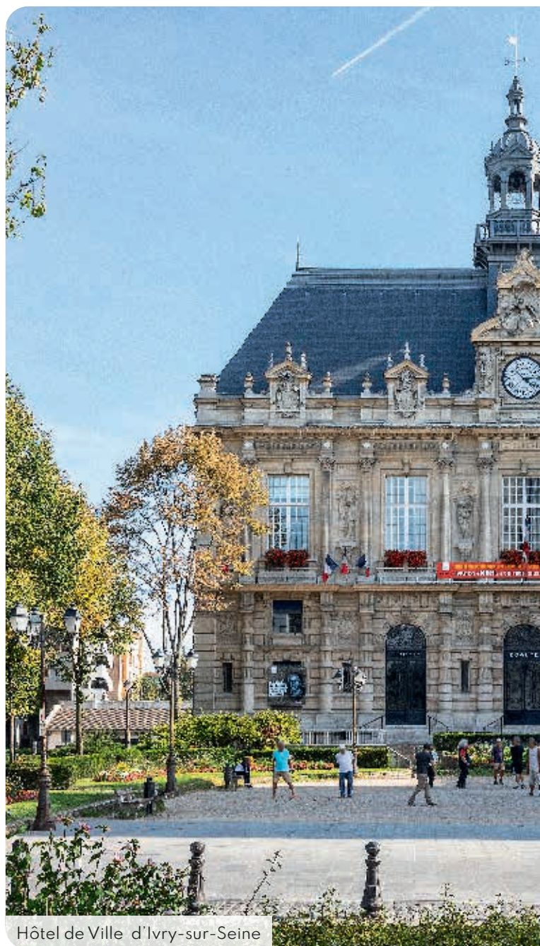
Hôtel de Ville d'Ivry-sur-Seine

+ de 115k étudiants à moins de 30 minutes* en transport des écoles