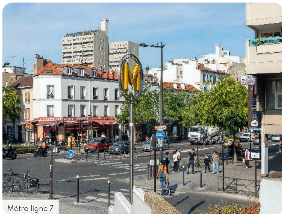
Métro ligne 7