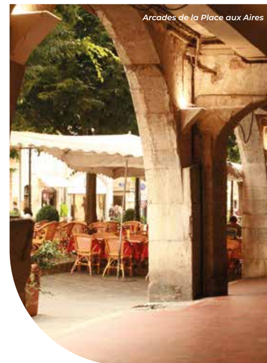
Arcades de la Place aux Aires

Aéroport international Nice Côte d'Azur à 34 km* (28 min en voiture)