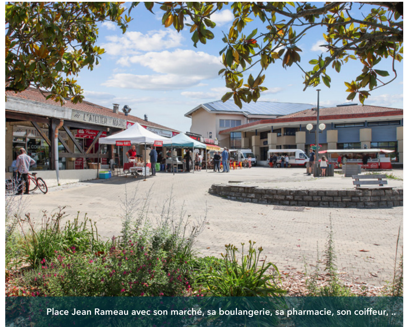
Place Jean Rameau avec son marché, sa boulangerie, sa pharmacie, son coiffeur, ..