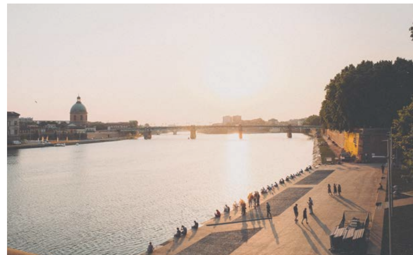
Les Berges de la Garonne et l'Hôtel-Dieu

Conjuguant avec brio éducation, culture, sport et loisirs, la ville rose irradie par sa vitalité mais aussi la richesse de ses équipements (Aéroport international Toulouse-Blagnac, future ligne LGV, métro, tramway, ...) qui lui confèrent une place de choix au carrefour de l'Europe.