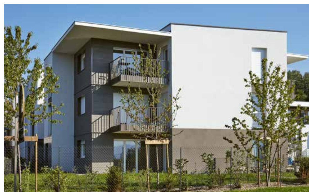
Les Hauts du Lac à Anthy-sur-Léman Architecte : David Ferré