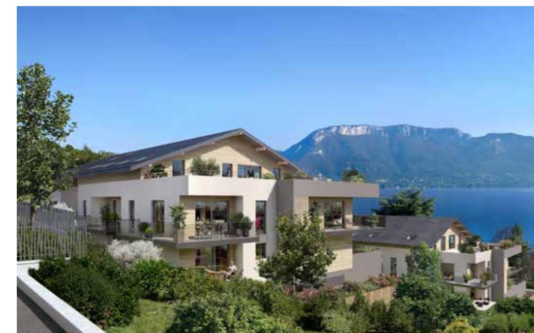
Les terrasses du lac à Sévrier Architecte : David Ferré