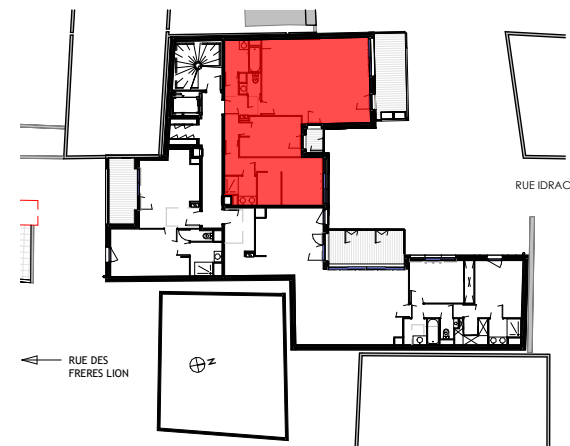
Apt N°05 - T3 Privilège - Etage 2 - EVOLUTIF