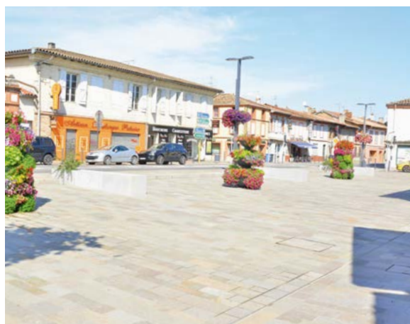
Place Yvan Paul Lafont