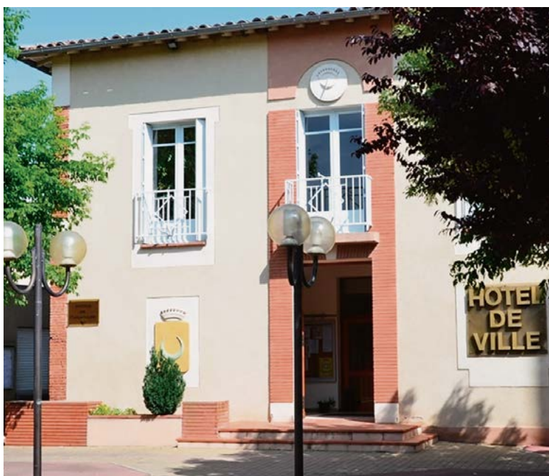
Mairie de Saint-Jory

Avec des équipements scolaires privés et publics qui vont jusqu'au lycée, Saint-Jory permet de construire sur ses terres, sa vie sur le long terme. Pour les sportifs, la ville propose également de nombreux équipements comme un gymnase, des courts de tennis et un stade ou encore un bowling et un laser-game. Pour des moments conviviaux le soir et le week-end, de nombreux bars et restaurants animent le centre-ville, la périphérie de Saint-Jory et les communes environnantes.