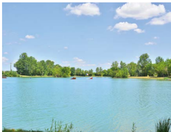
Lac de Braguessou