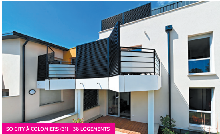
SO CITY À COLOMIERS (31) - 38 LOGEMENTS