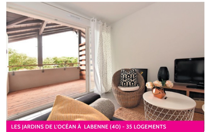
LES JARDINS DE L'OcéAN À LABENNE (40) - 35 LOGEMENTS