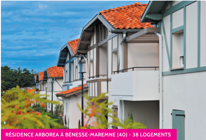
RÉSIDENCE ARBOREA À BÉNESSE-MAREMNE (40) - 38 LOGEMENTS