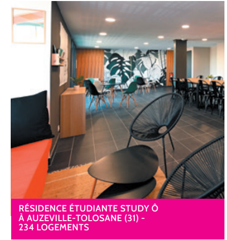
RÉSIDENCE ÉTUDIANTE STUDY Ô À AUZEVILLE-TOLOSANE (31) - 234 LOGEMENTS