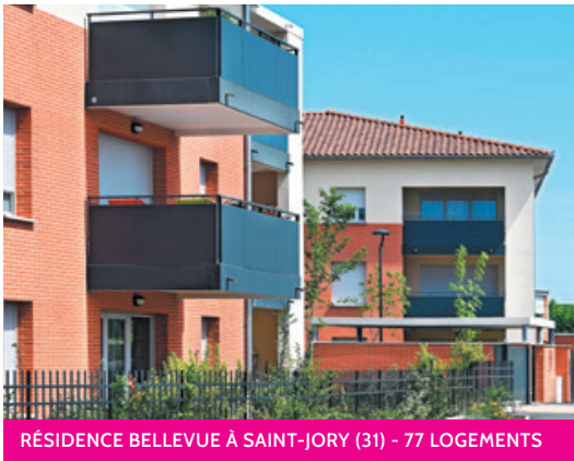
RÉSIDENCE BELLEVUE À SAINT-JORY (31) - 77 LOGEMENTS