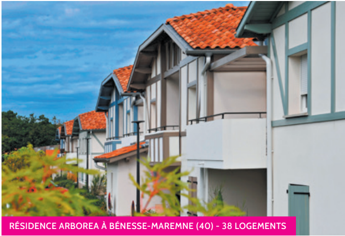
RÉSIDENCE ARBOREA À BÉNESSE-MAREMNE (40) - 38 LOGEMENTS