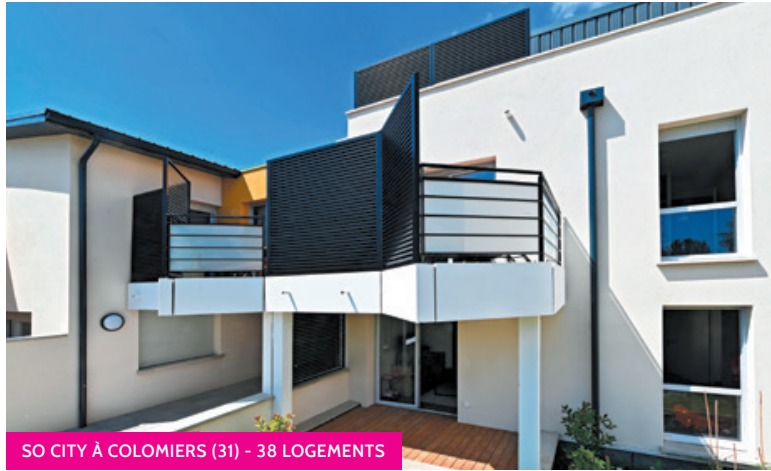
SO CITY À COLOMIERS (31) - 38 LOGEMENTS