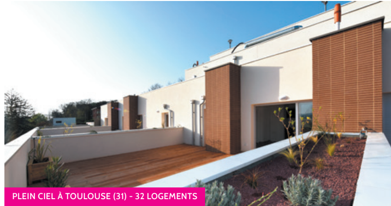
PLEIN CIEL À TOULOUSE (31) - 32 LOGEMENTS

28 ANNÉES D'EXISTENCE + de 10 000 LOGEMENTS CONSTRUITS