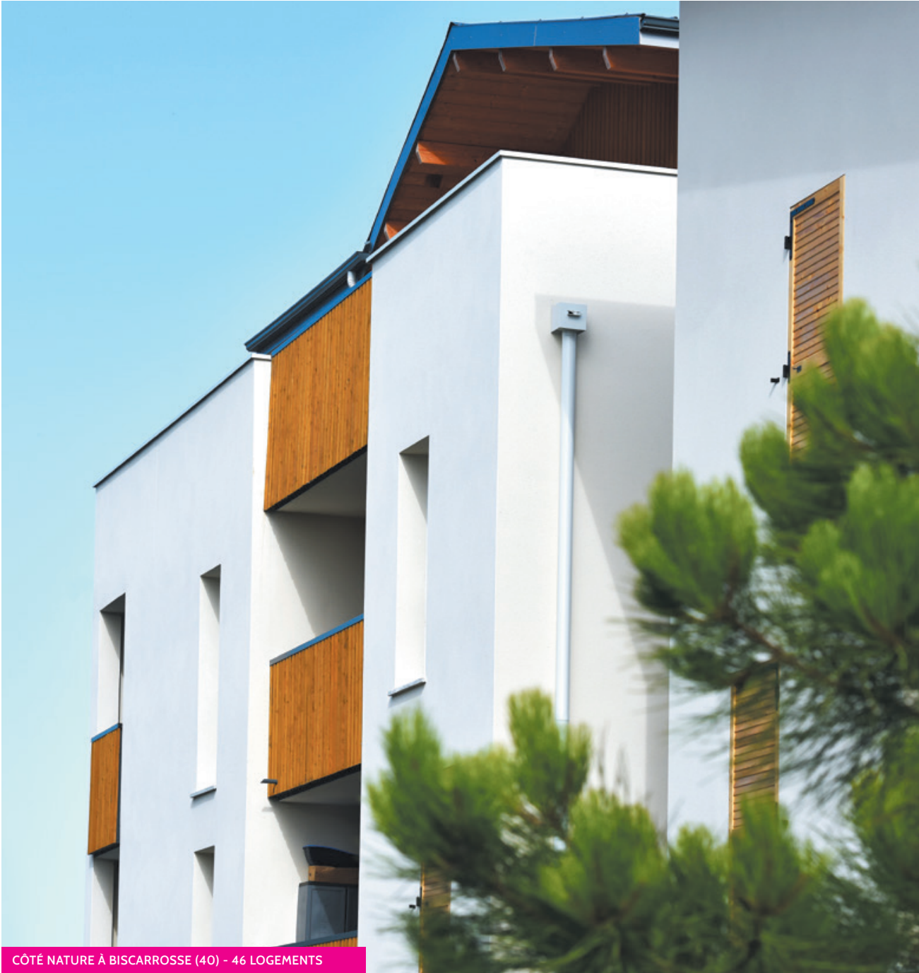
CÔTÉ NATURE À BISCARROSSE (40) - 46 LOGEMENTS