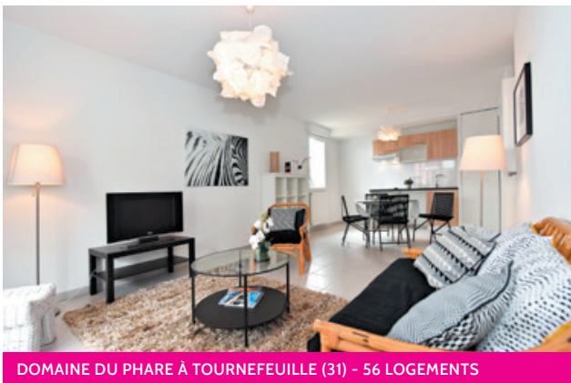
DOMAINE DU PHARE À TOURNEFEUILLE (31) - 56 LOGEMENTS

28 ANNÉES D'EXISTENCE + de 10 000 LOGEMENTS CONSTRUITS