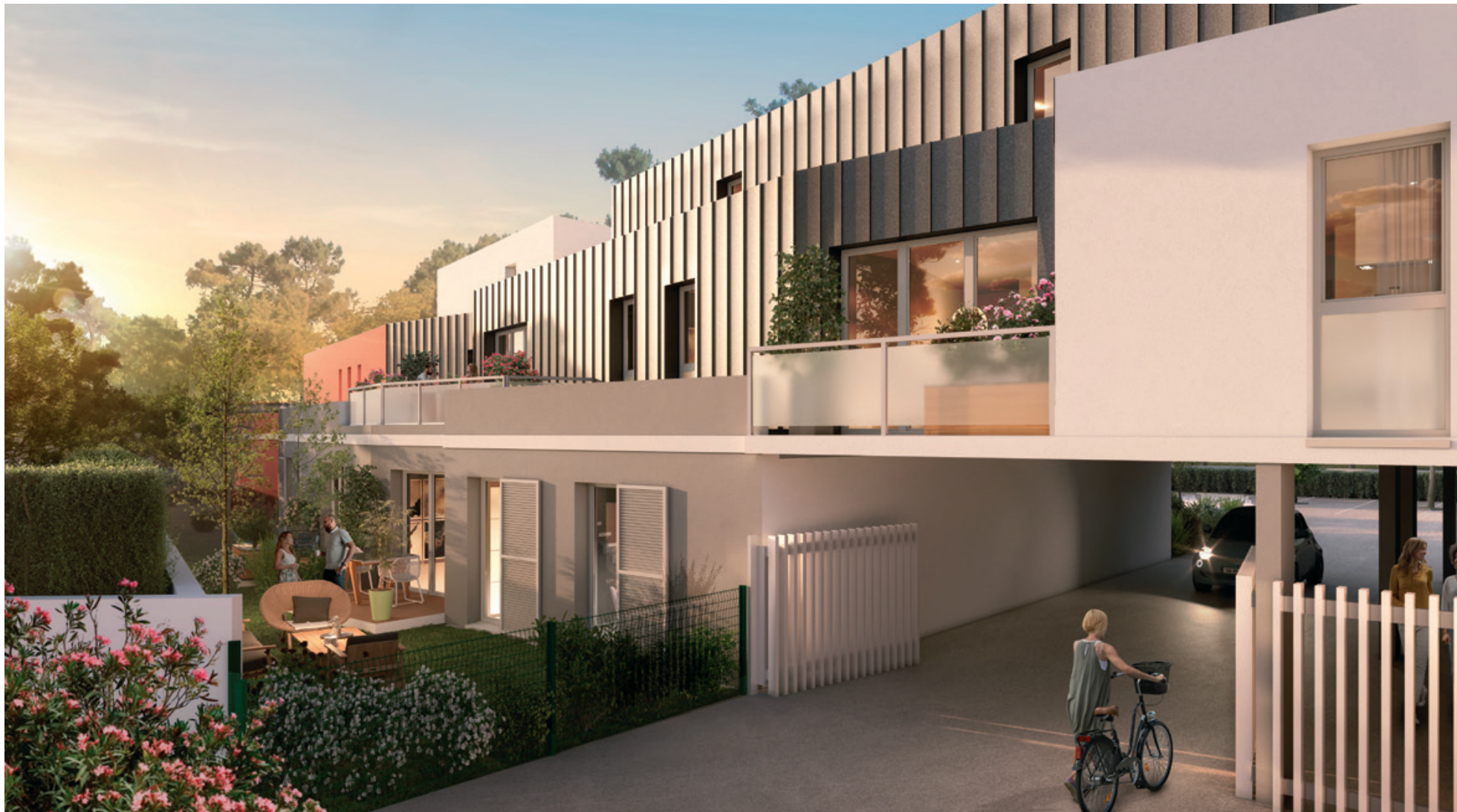
Le Clos des Azalées | PERPIGNAN (66)