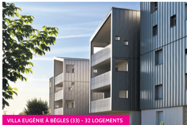
VILLA EUGÉNIE À BÈGLES (33) - 32 LOGEMENTS