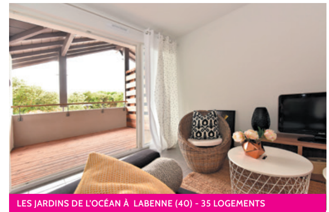
LES JARDINS DE L'OcéAN À LABENNE (40) - 35 LOGEMENTS