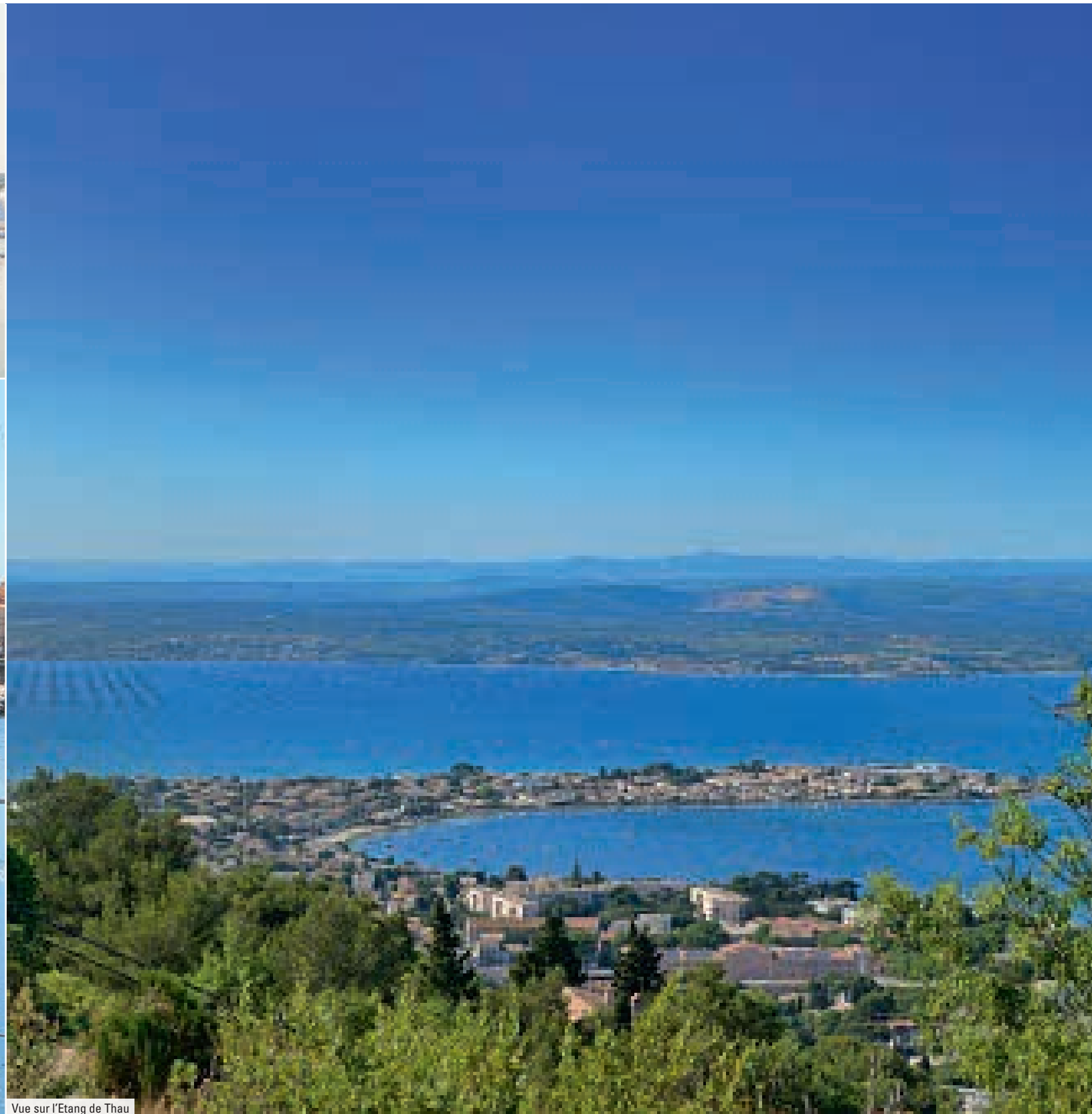
Vue sur l'Étang de Thau