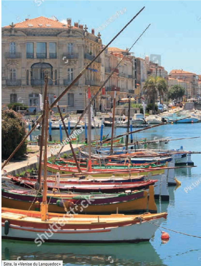
Sète, la «Venise du Languedoc»