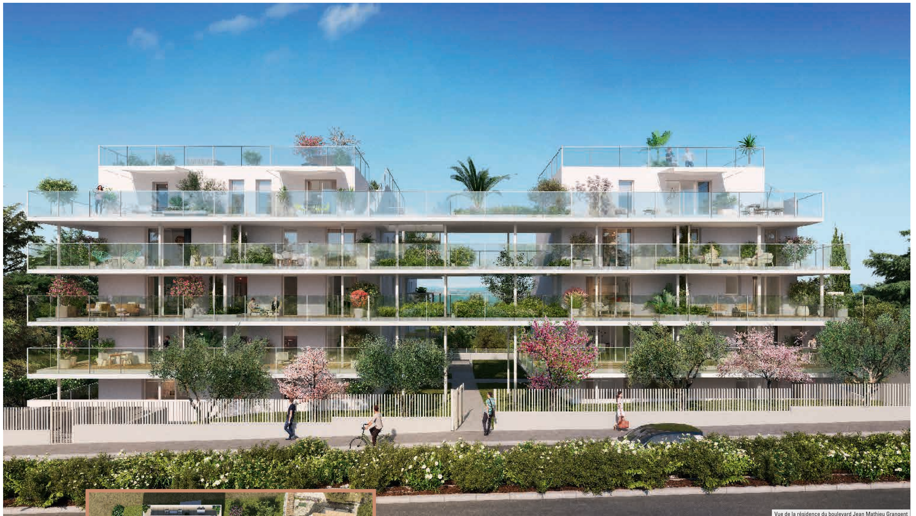
Vue de la résidence du boulevard Jean Mathieu Grangent