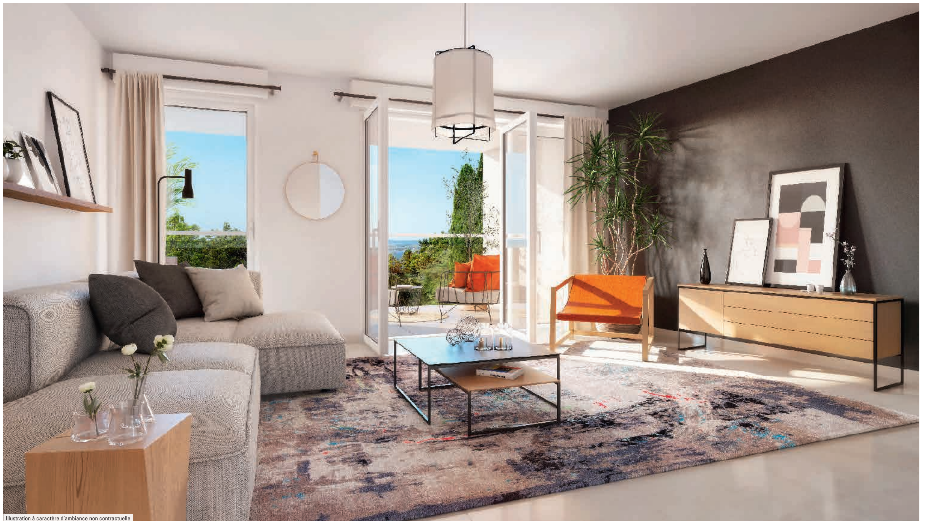
Illustration à caractère d'ambiance non contractuelle