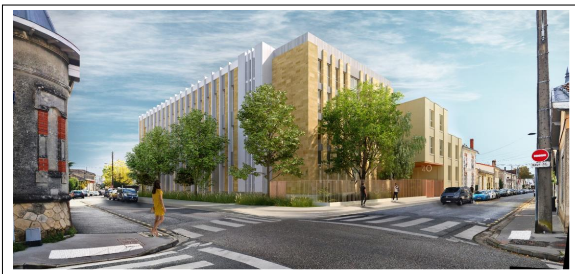
Image non contractuelle à caractère d'ambiance