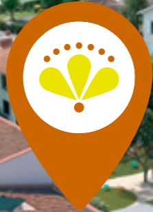
Vue drone de la résidence