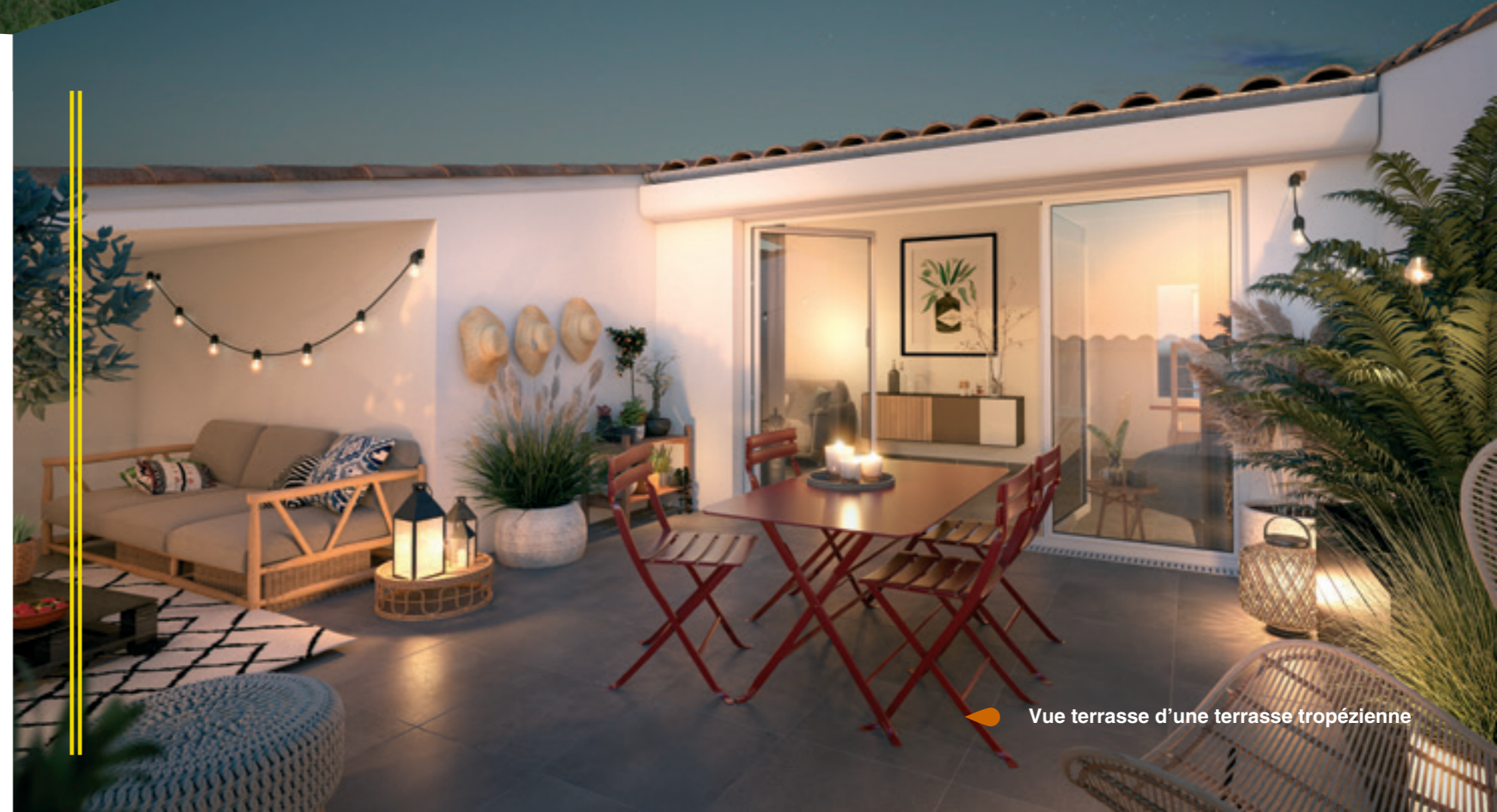
Vue terrasse d'une terrasse tropézienne