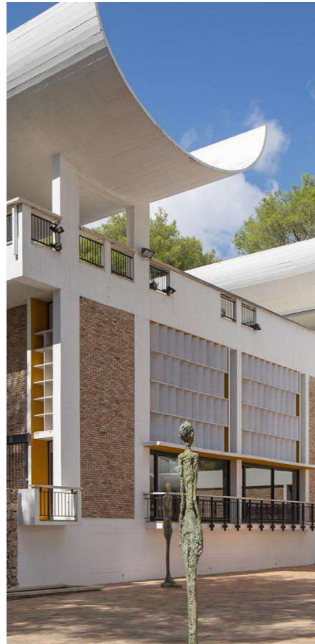
FONDATION MAEGHT À SAINT-PAUL DE VENCE