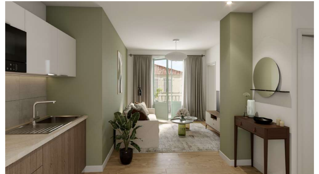
UNE RÉNOVATION SOIGNÉE ET AUX MATÉRIAUX CHOISIS