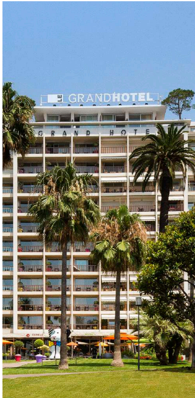
GRAND HÔTEL DE CANNES