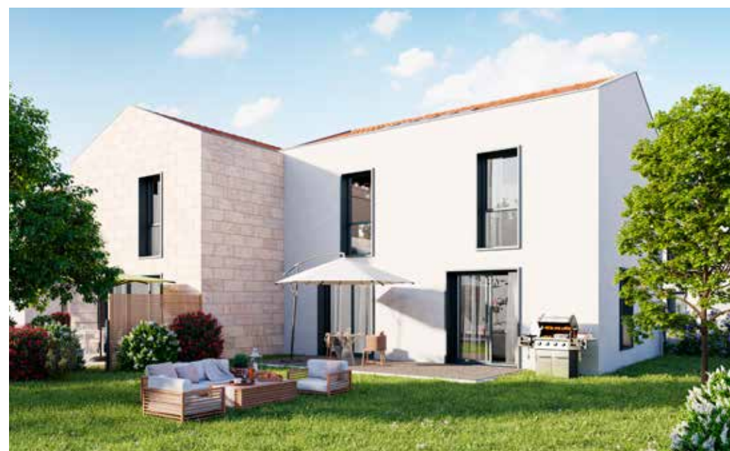
Villa Brugeaise à Bruges Architecte : Atelier Alonso Sarraute