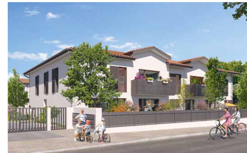
Domaine du Ruisseau à Audenge Architecte : Agence ML2 Architecture