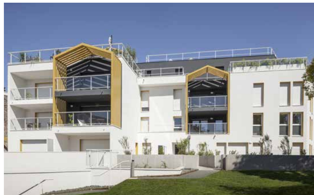
Les Terrasses de Saint-Augustin à Mérignac Architecte : Agence d'architecture URB1N