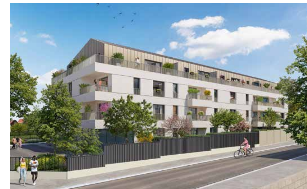
Résidence Le Coty à Ambarès-et-Lagrave Architecte : Agence M2L Architectes