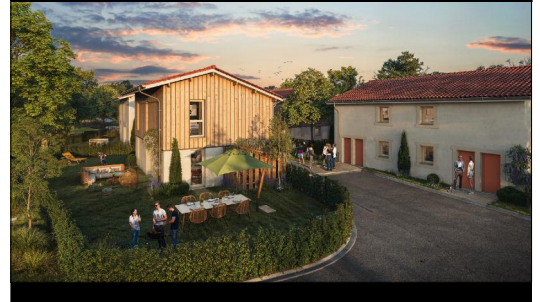
Plan de situation / Plan de masse