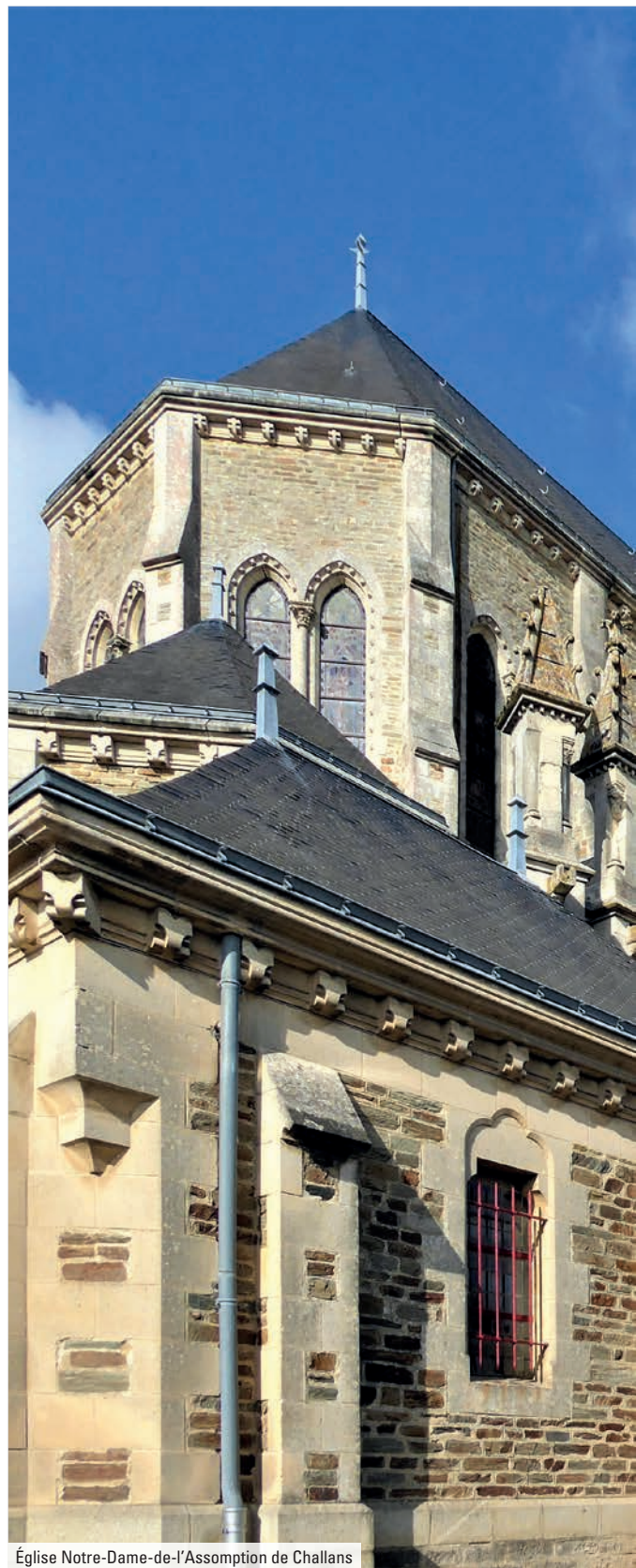
Église Notre-Dame-de-l'Assomption de Challans

Se déplacer est enfin d'une grande facilité grâce à la gare de Challans à 4 min* et l'arrêt de bus à 5 min* à pied, dont une ligne dessert Saint-Jean-de-Monts et La Barre-de-Monts.