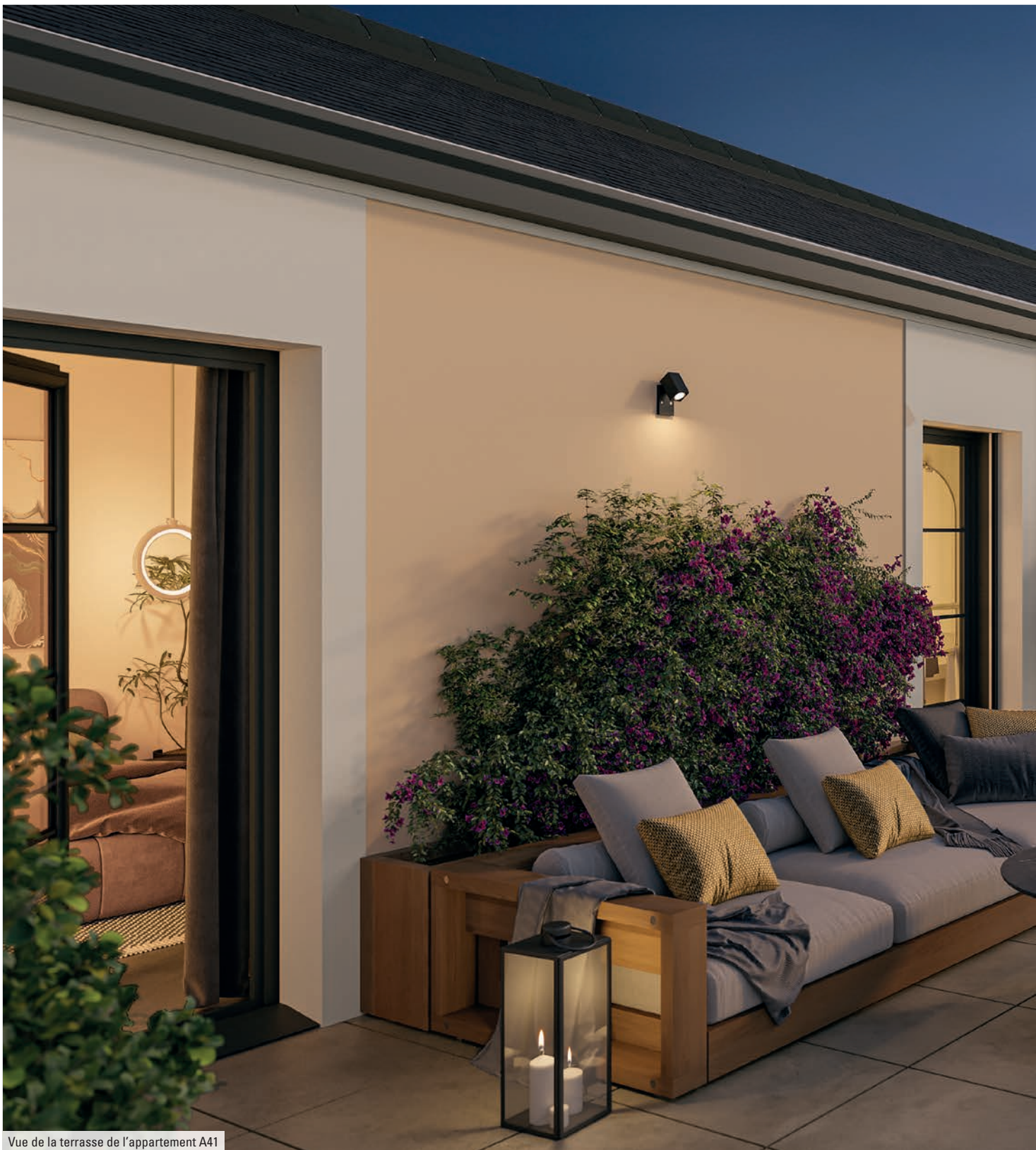
Vue de la terrasse de l'appartement A41