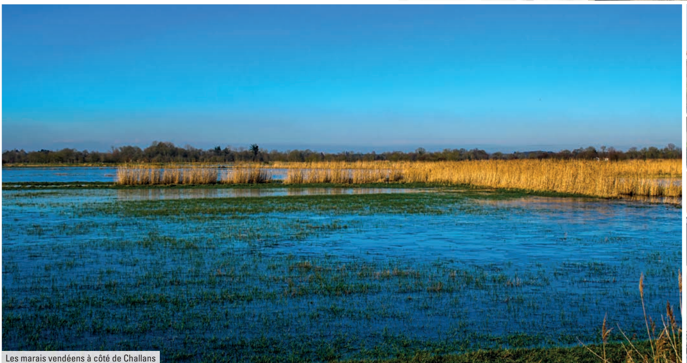
Les marais vendéens à côté de Challans