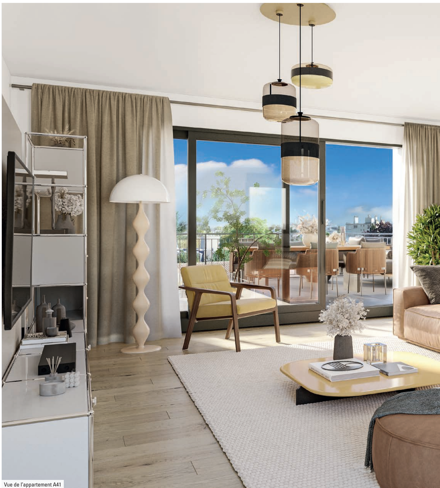
Vue de l'appartement A41

DES INTÉRIEURS OÙ IL FAIT BON VIVRE, SEREINEMENT ET CONFORTABLEMENT