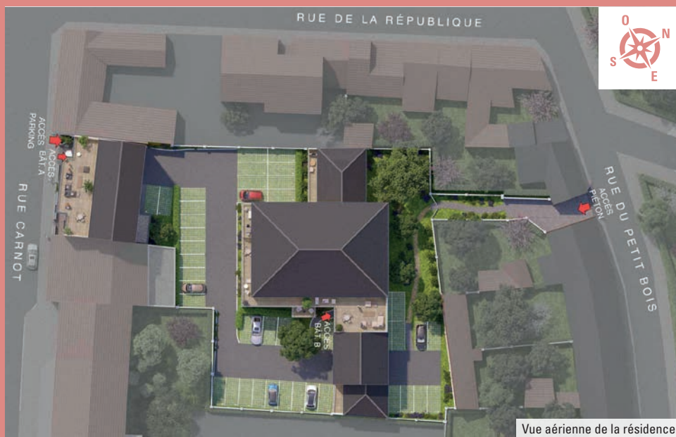
Vue aérienne de la résidence