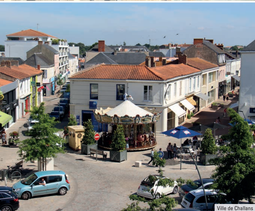
Ville de Challans